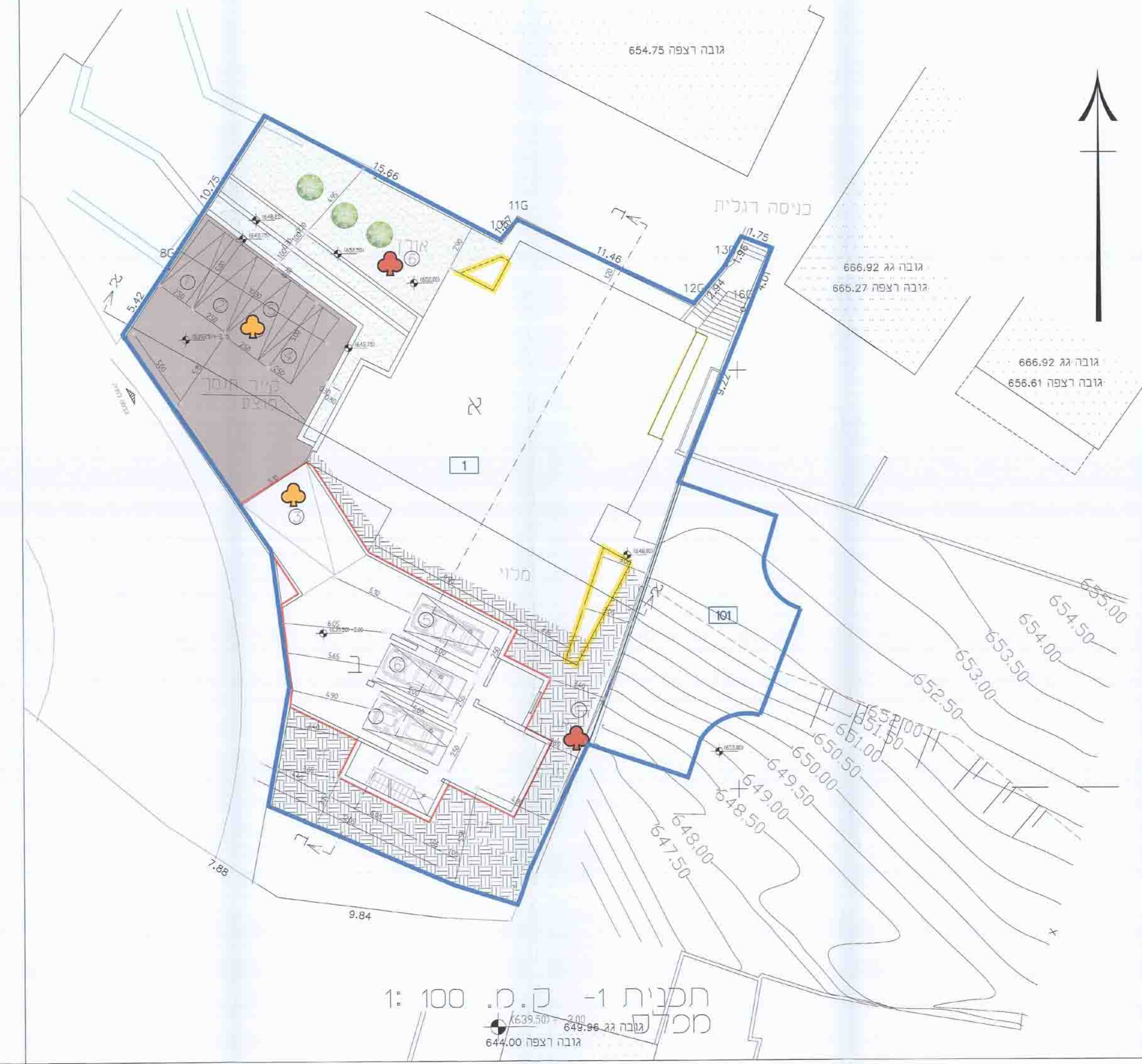
תכנית 1-1 - ק.מ. 100 : 1 מכלס גובה 22 גובה 649.96 גובה רצפה 644.00