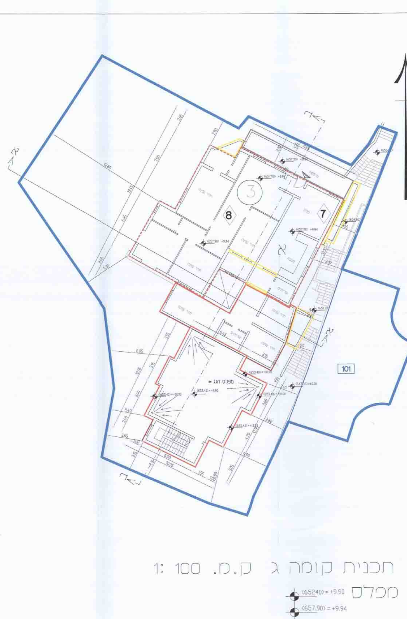
תכנית קומה ג ק.מ. 100 : 1 מכלס גובה 22 גובה 649.96 גובה רצפה 644.00