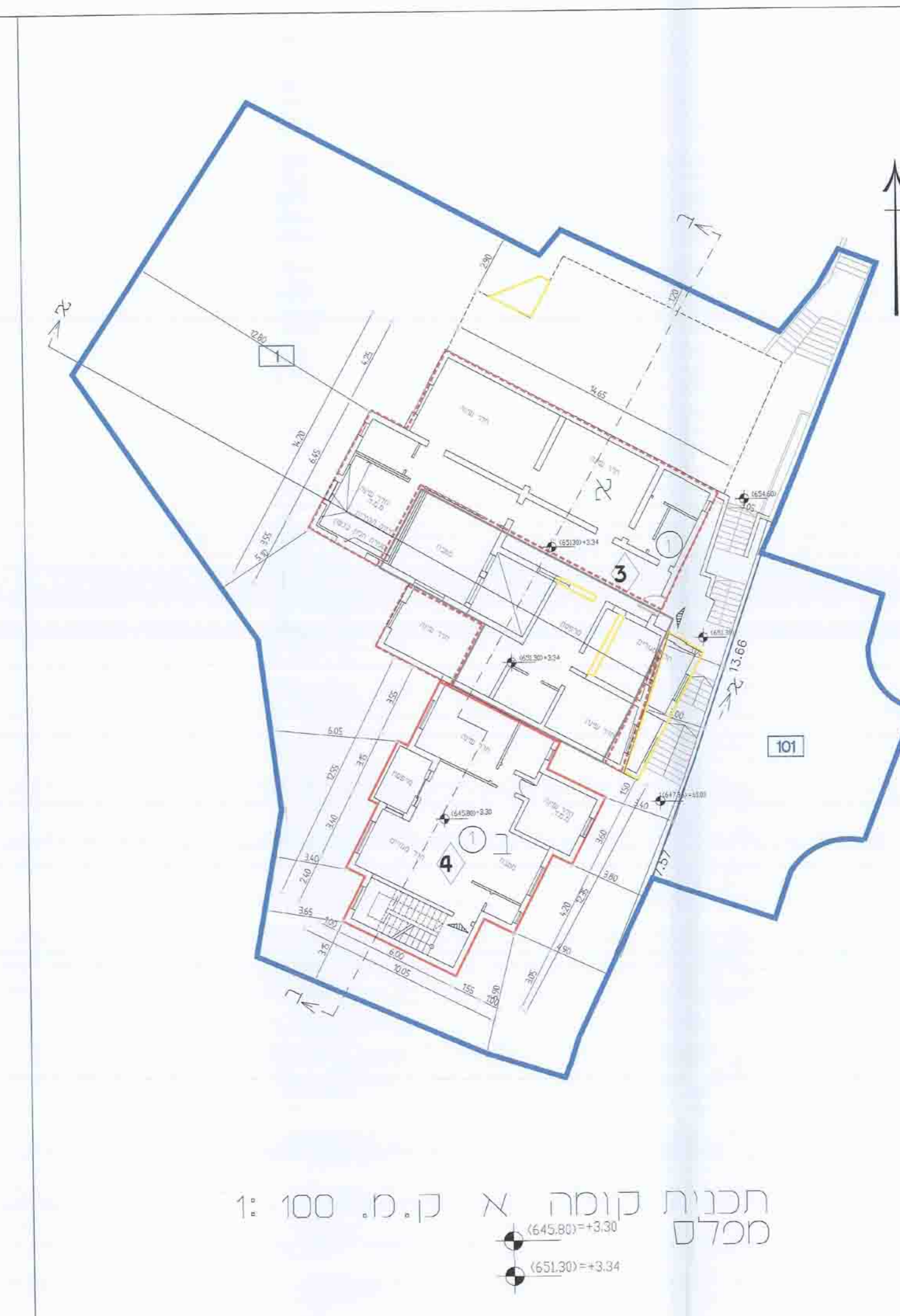
תכנית קומה א ק.מ. 100 : 1 מכלס גובה 22 גובה 649.96 גובה רצפה 644.00