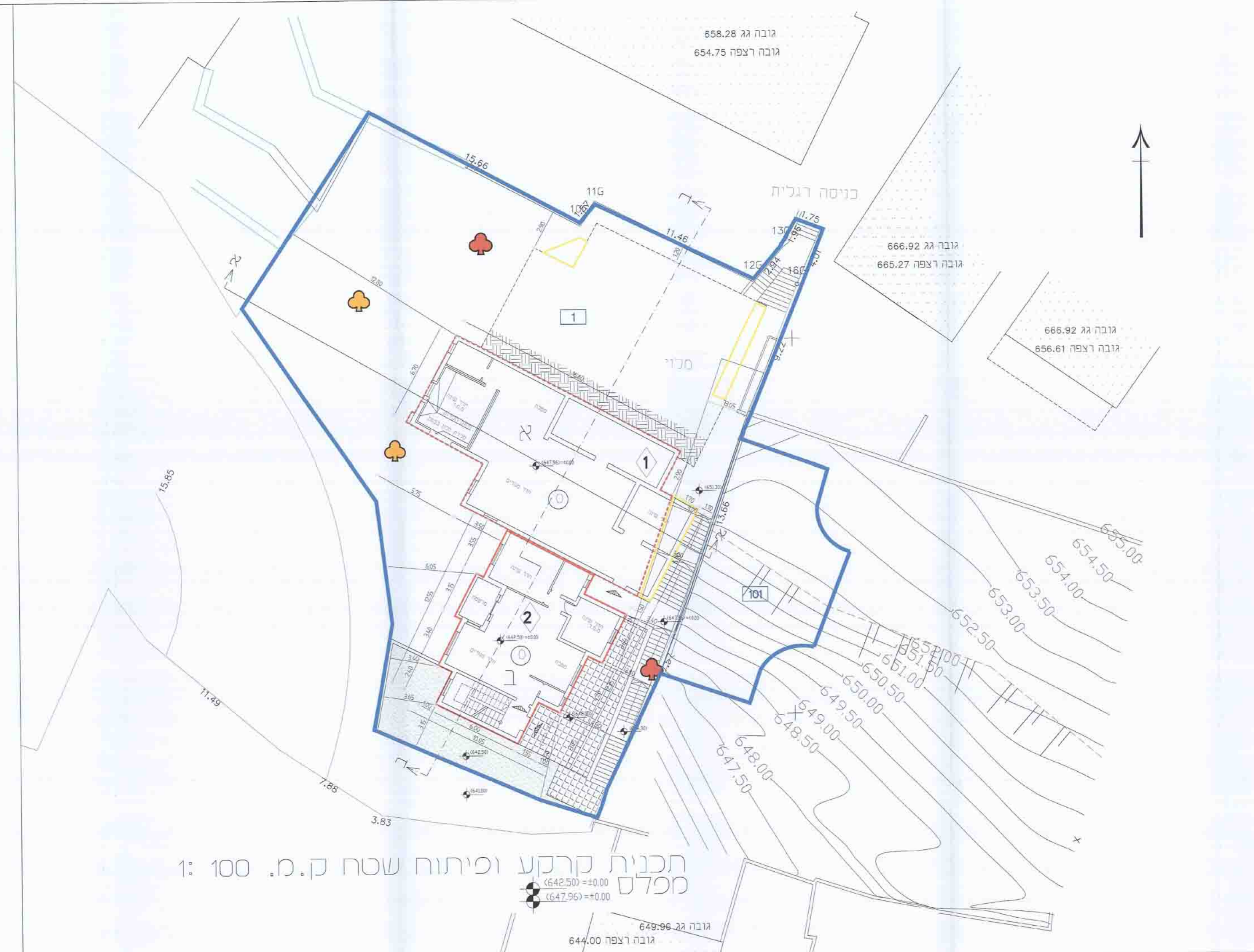
תכנית קרקע ופיתוח שטח ק.מ. 100 : 1 מכלס גובה 22 גובה 649.96 גובה רצפה 644.00