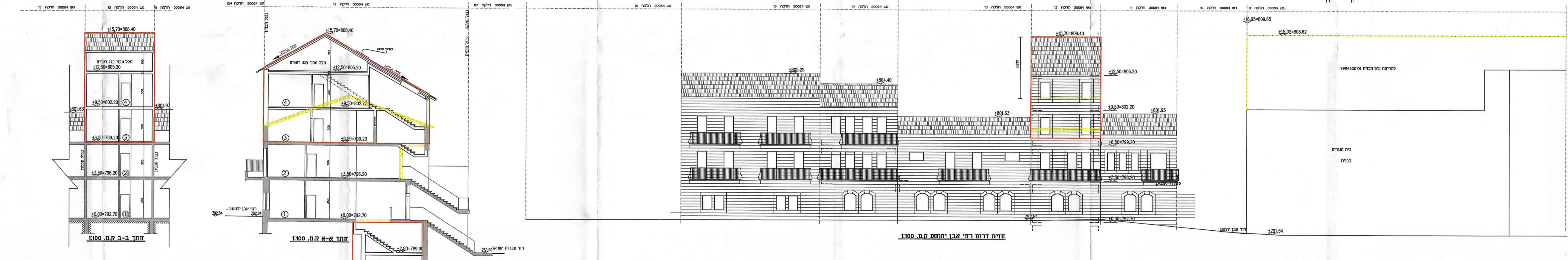
חזית דרום רחי אבן יהושע ק.ת. 100 חזית צפון רחי עבודת ישראל ק.ת. 100 חזית א-א ק.ת. 100 חזית ב-ב ק.ת. 100