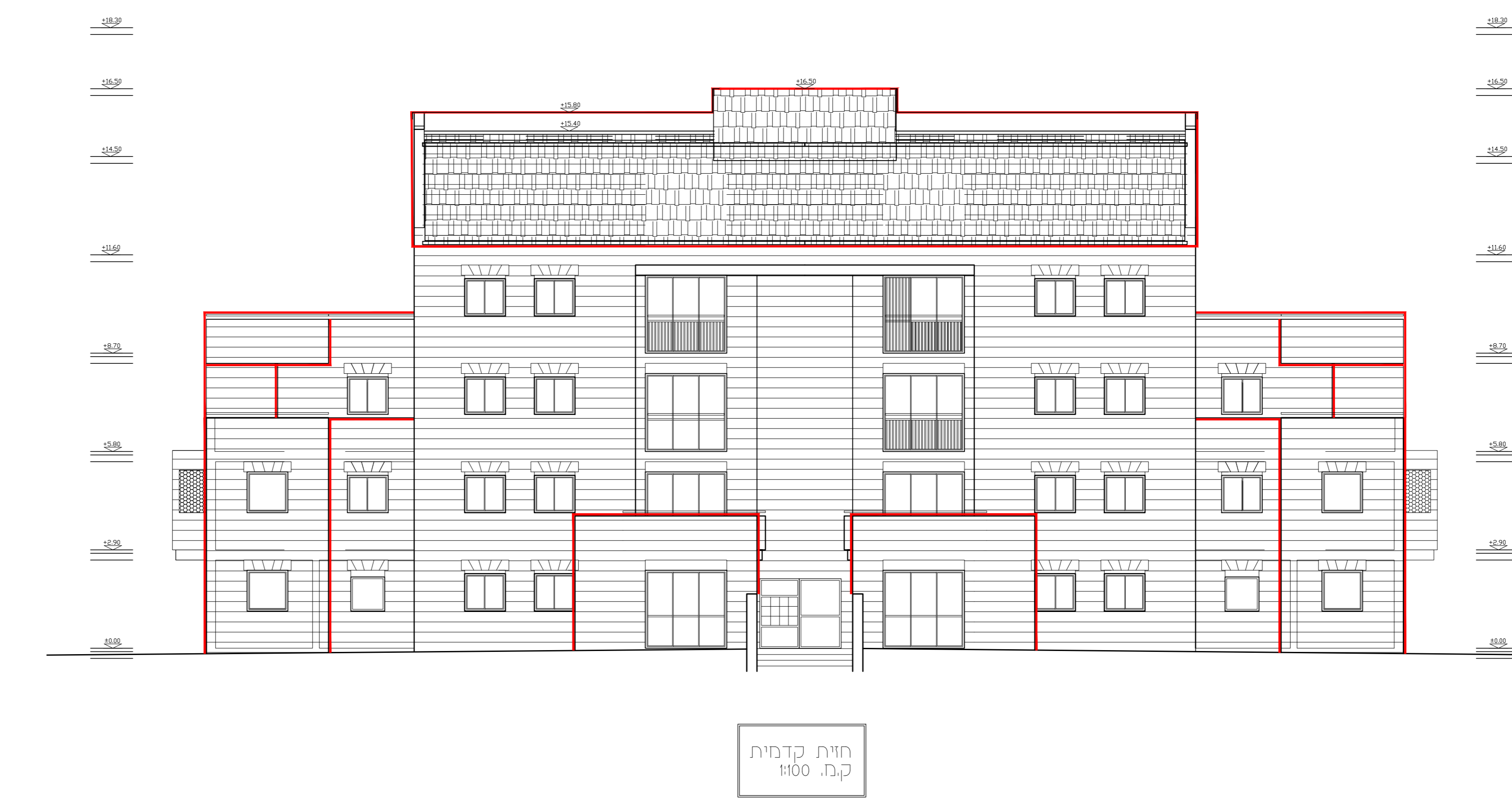
חית קדמית ק.מ. 1:100