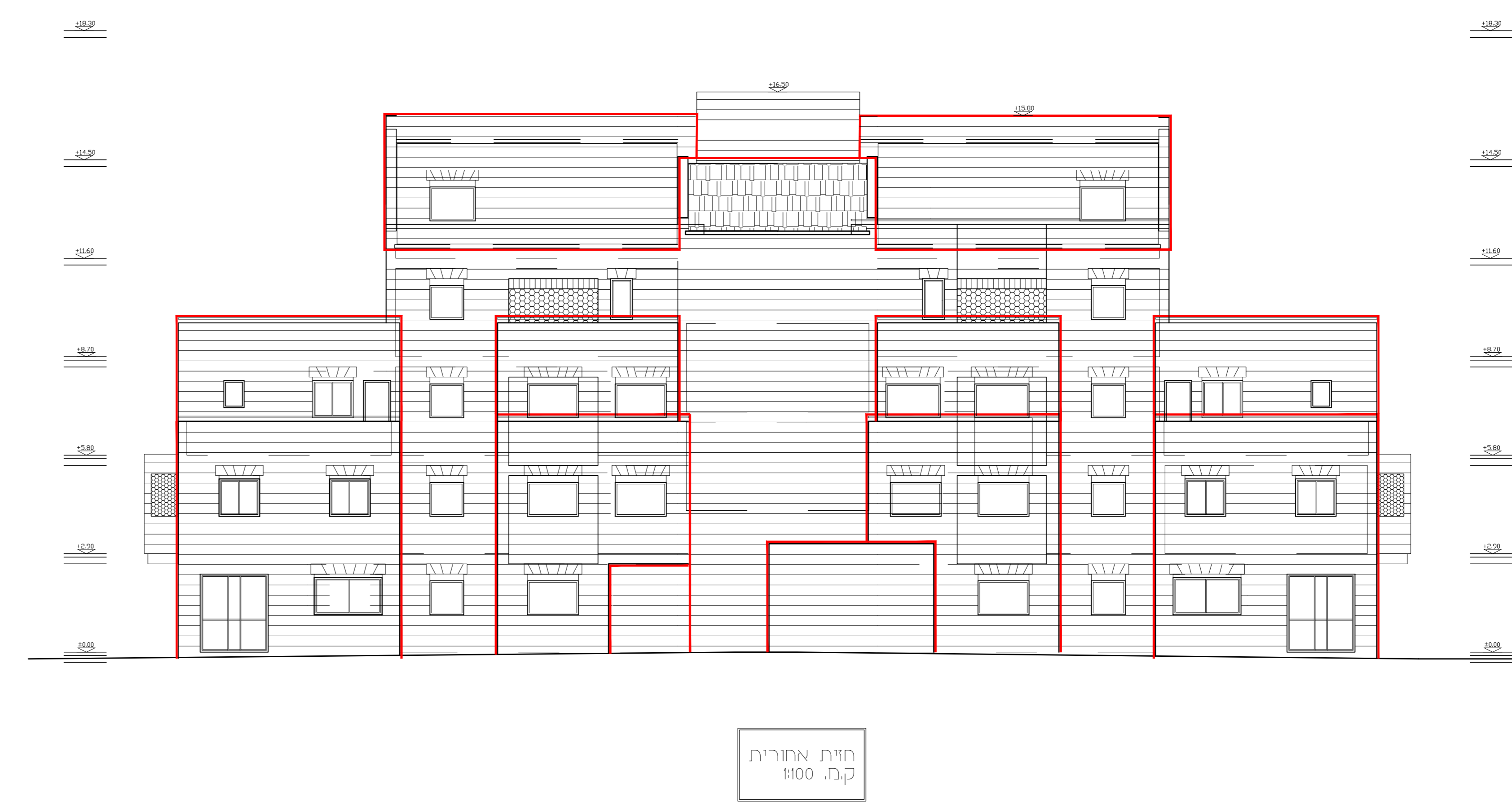
חית אחורית ק.מ. 1:100