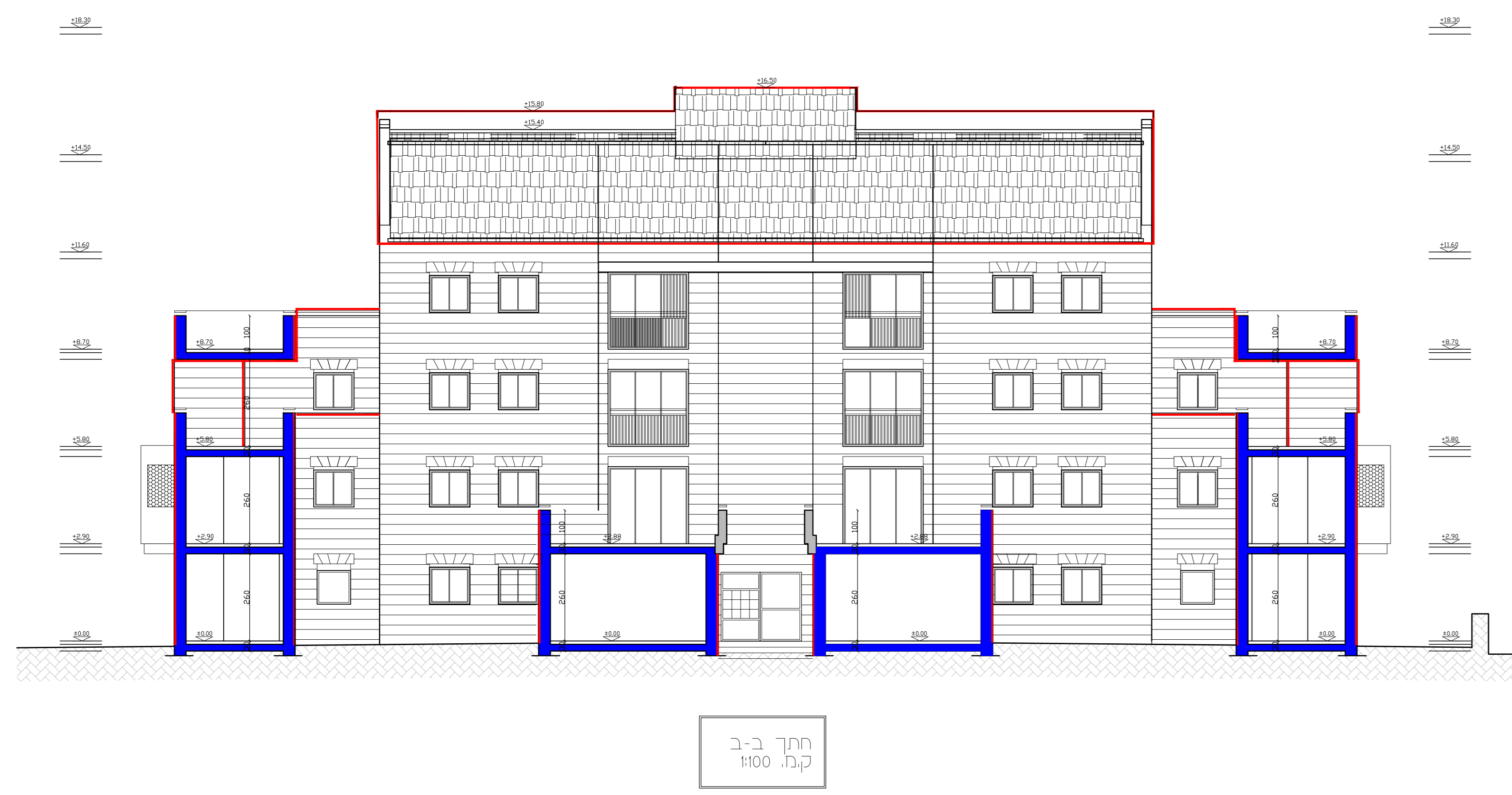
חית ב-ב ק.מ. 1:100