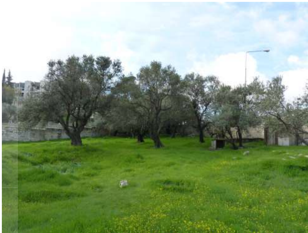
עצים מס' 2034-2029