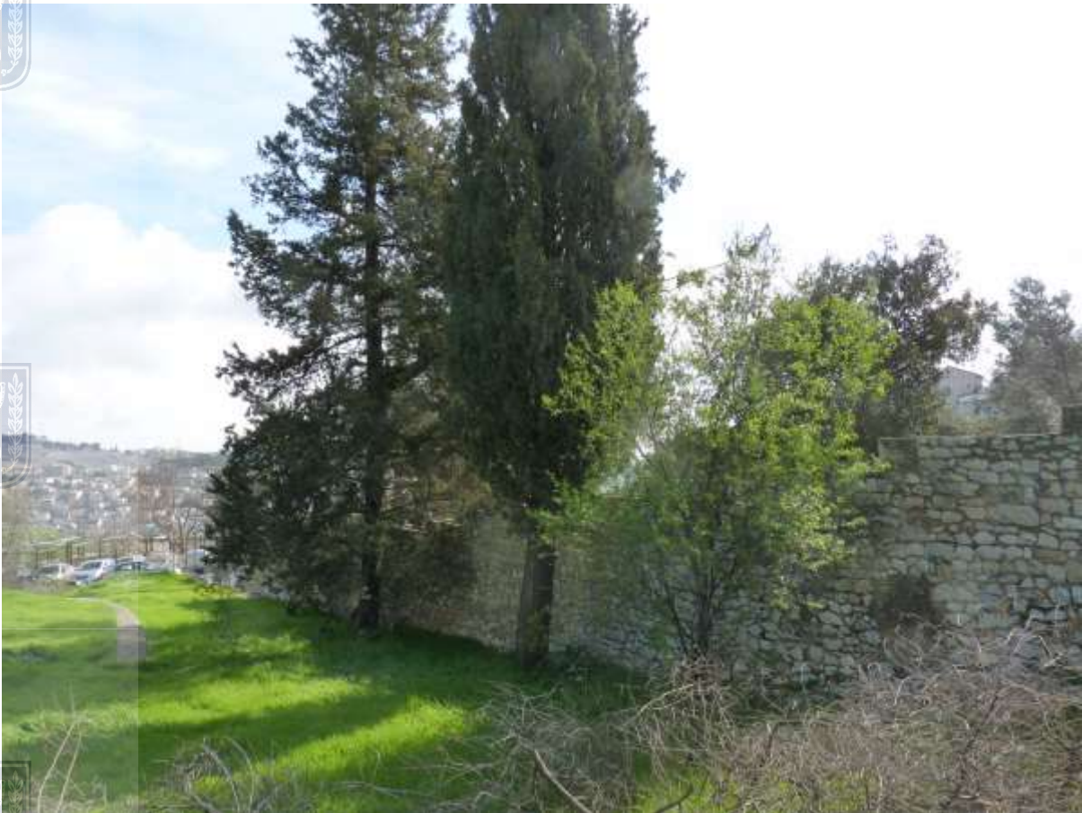
עצים מס' 2003-2001