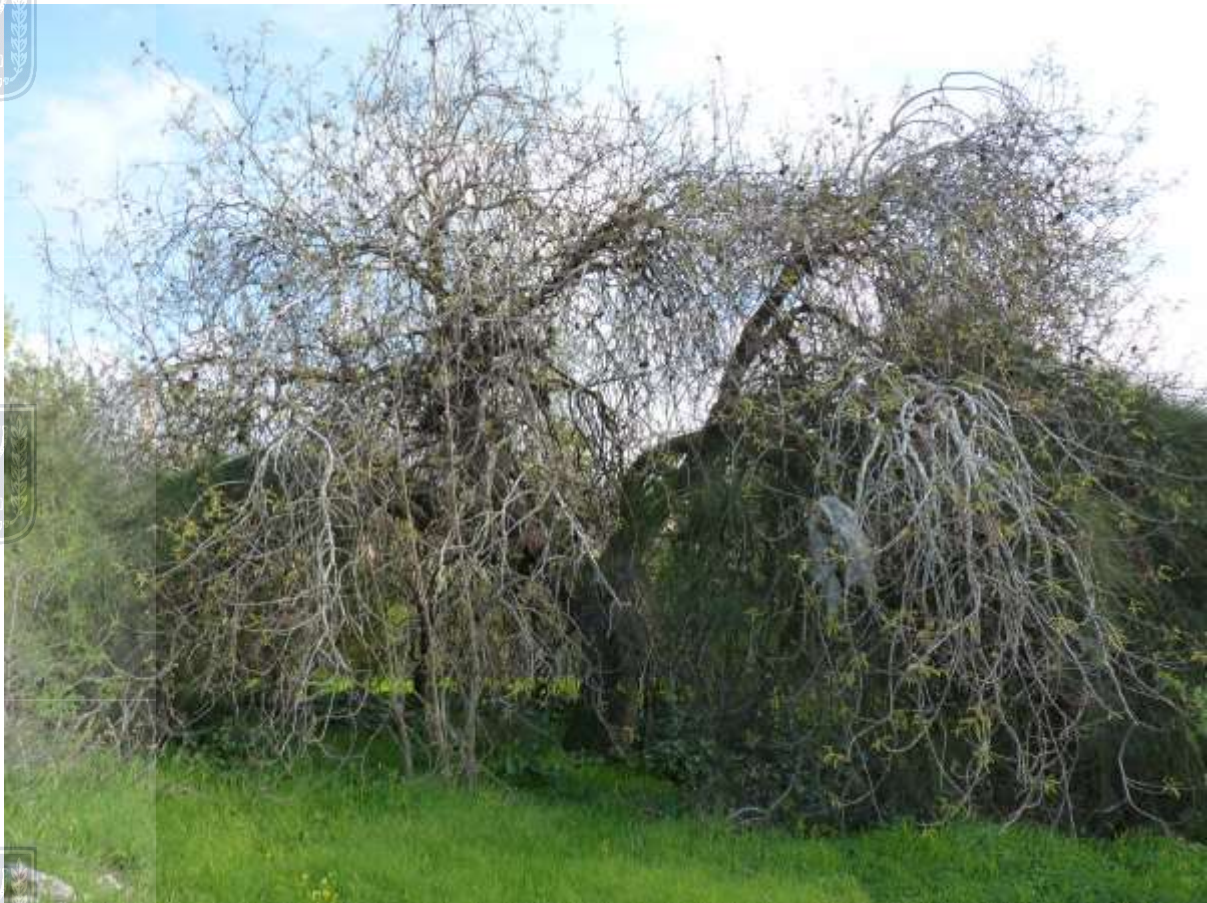
עץ מס' 2012