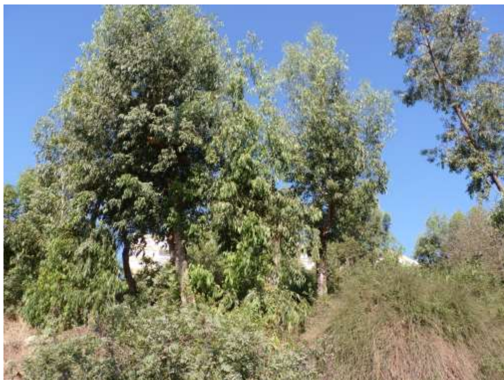
עץ מס' 853