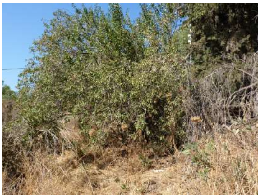
עץ מס' 864