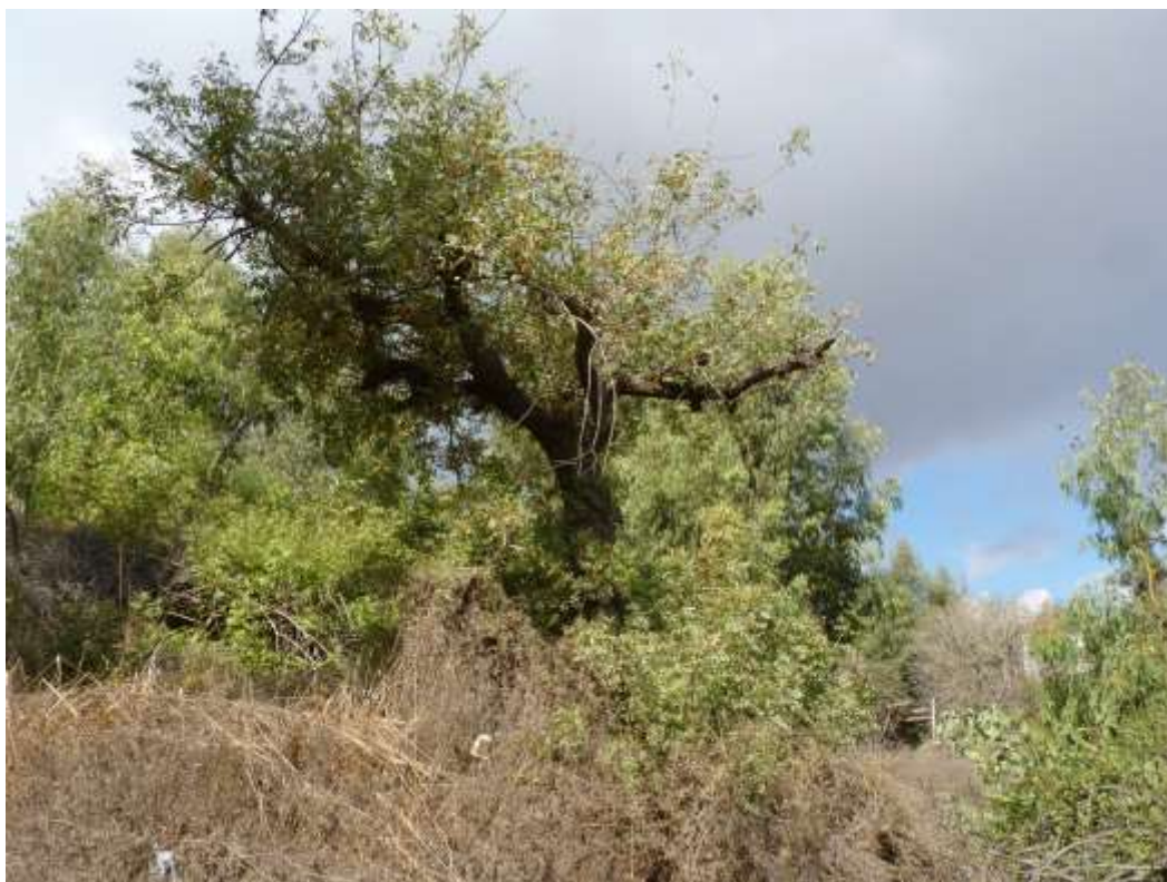
עץ מס' 831