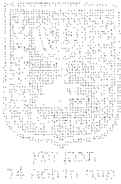
תפקיד יו"ר משרד התכנון והבניה