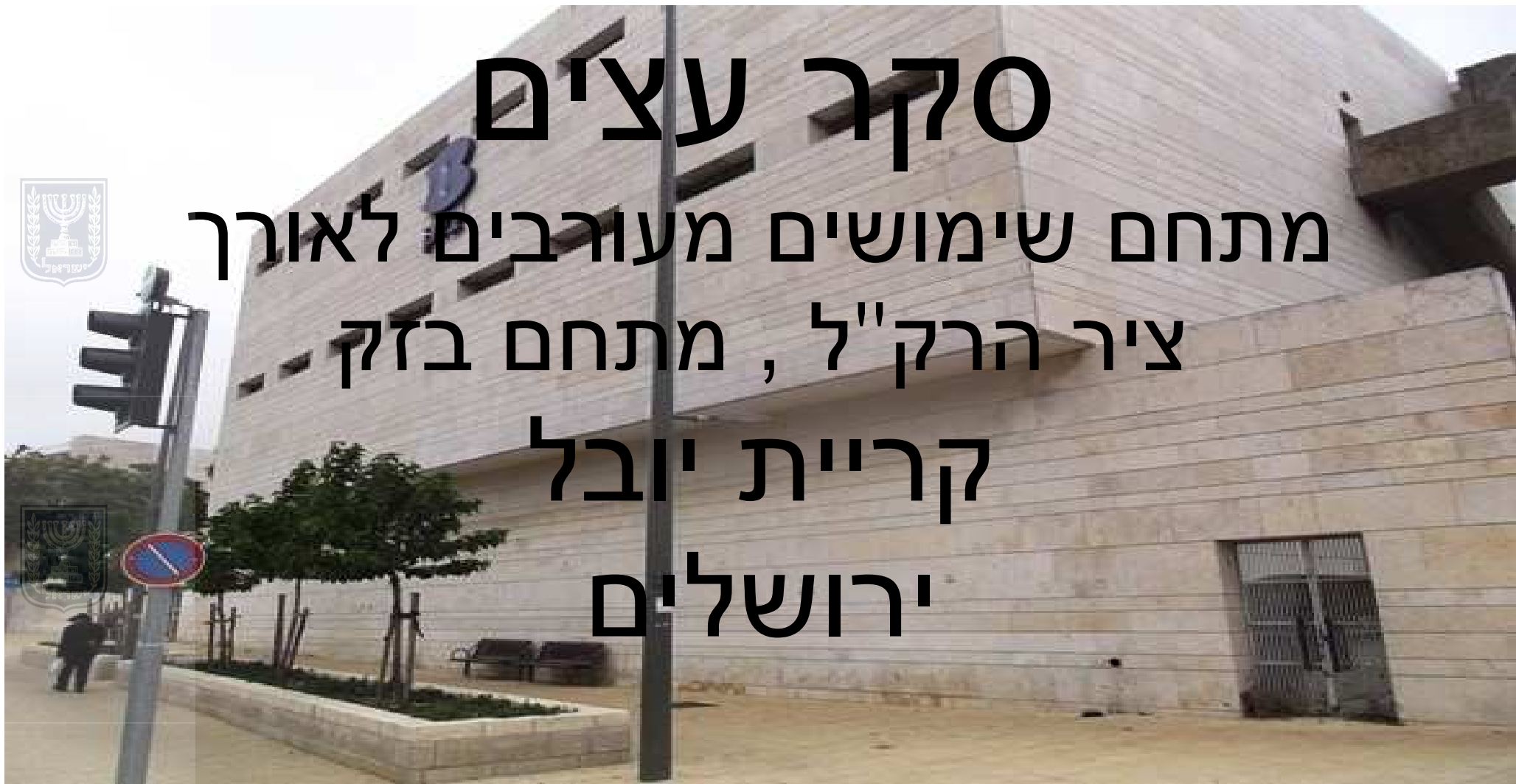
סקר עצים - מגדל בזק - רח צילה- ירושלים - 30.08.18