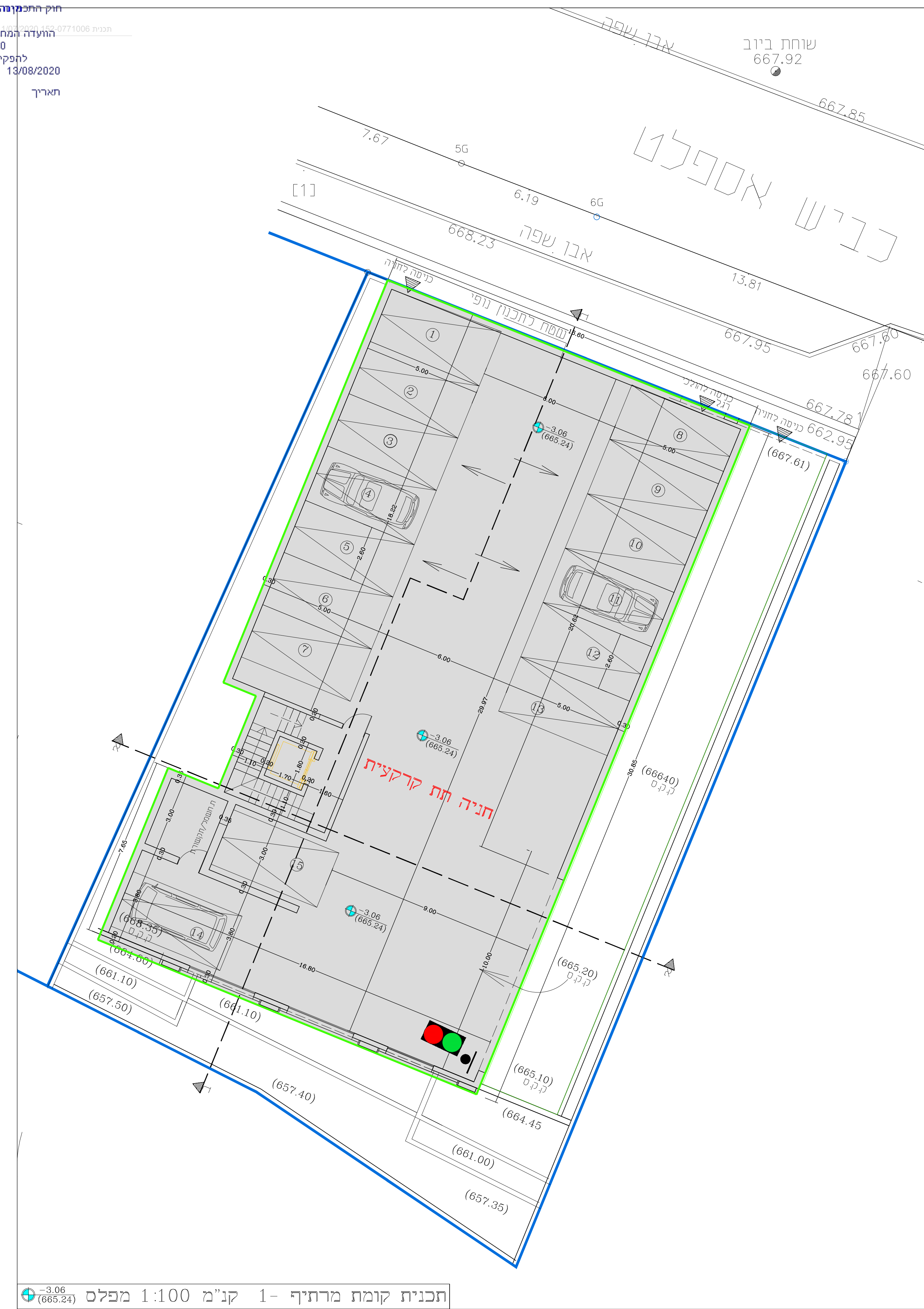
תכנית קומת מרתף 1- קנ"מ 1:100 מפלס \pm 0.00 (665.24)