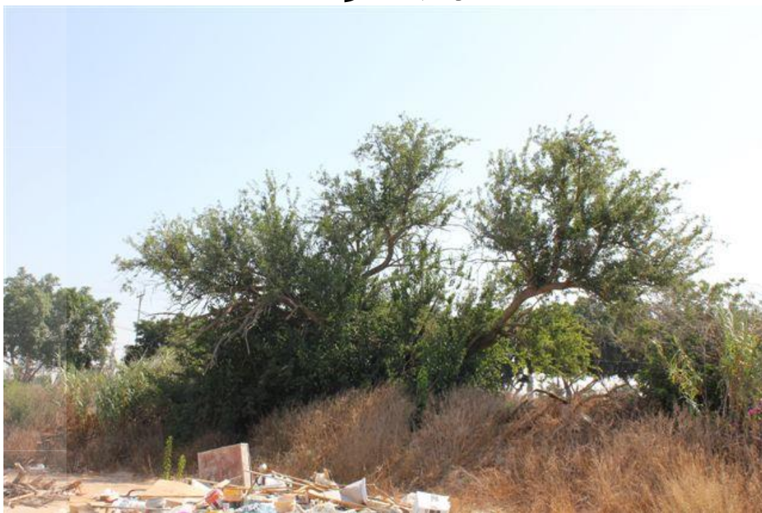
צילום 6615 פיקוס עתיק - עץ מספר 1