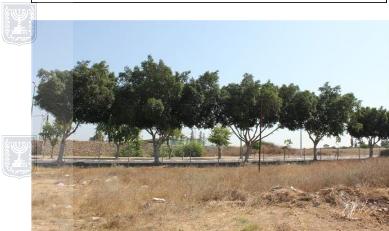
צילום 6617 קבוצת עצי פיקוס - עצים מספר 11-17 לאורך שד' עופר אשקלון