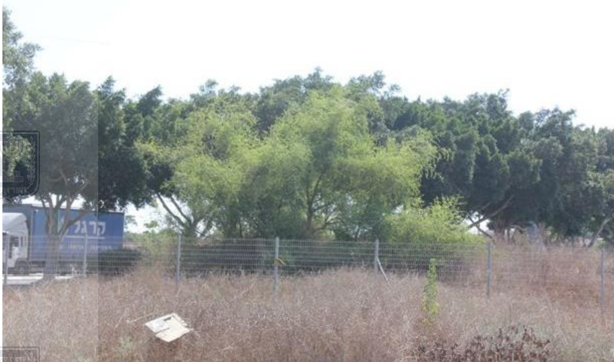
צילום 6621 - דומים (שיזף) - עץ מספר 6