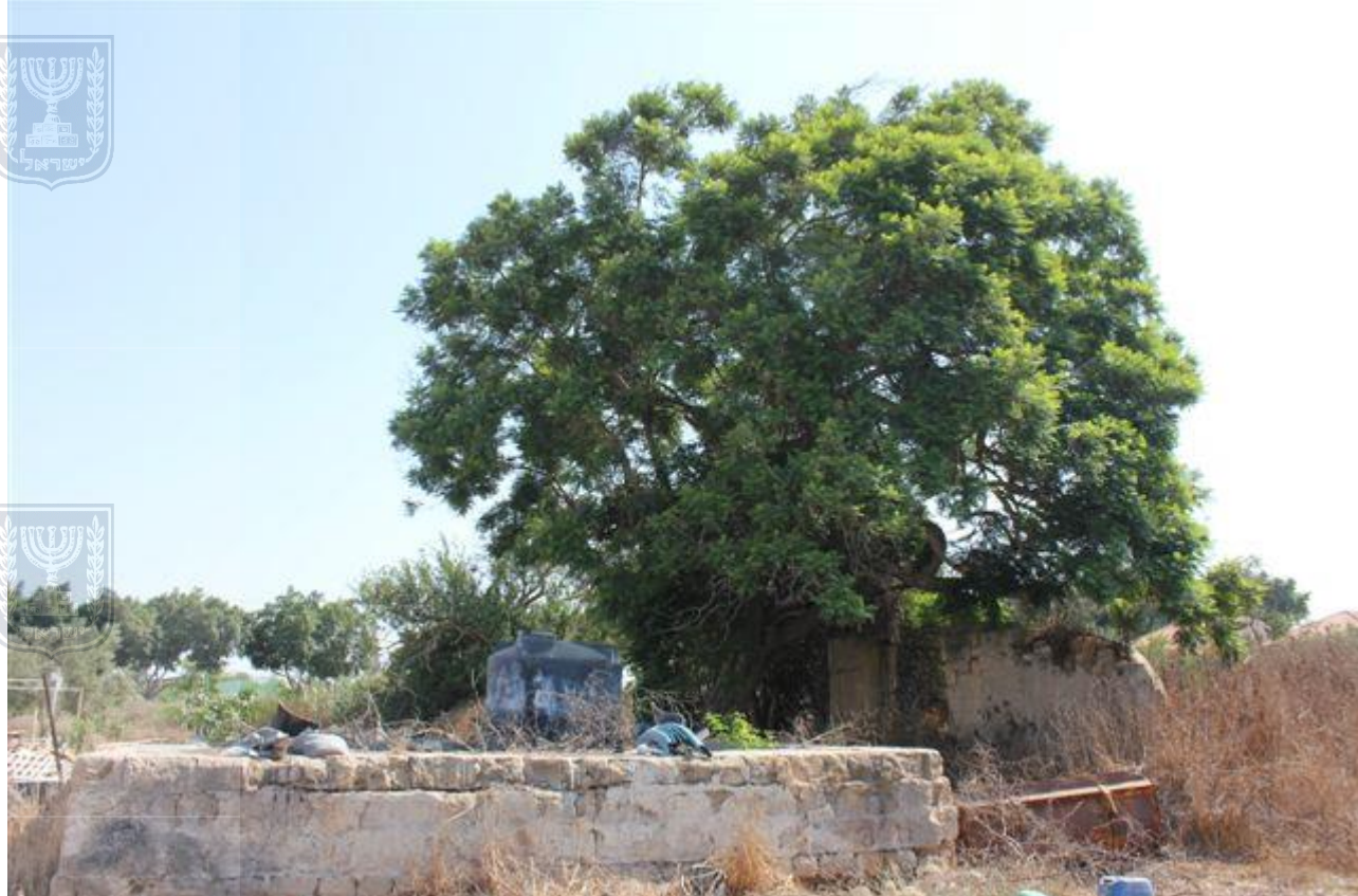
צילום 6615 - פיקוס עתיק עץ מספר 5