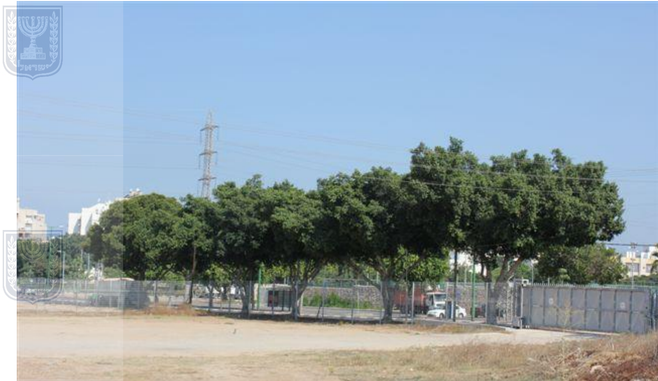
צילום 6613 קבוצת עצי פיקוס - עצים מספר 7,8,9,10 לאורך שד' עופר אשקלון