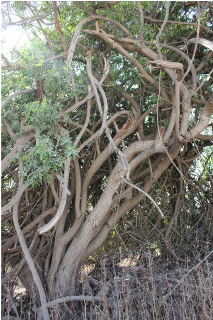
צילום 6622 - פלפלון - עץ מספר 4