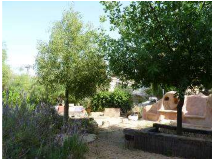
עצים : 102,752