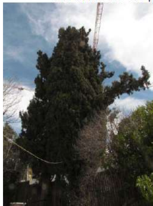
עץ מסי 763 : ברוש מצוי