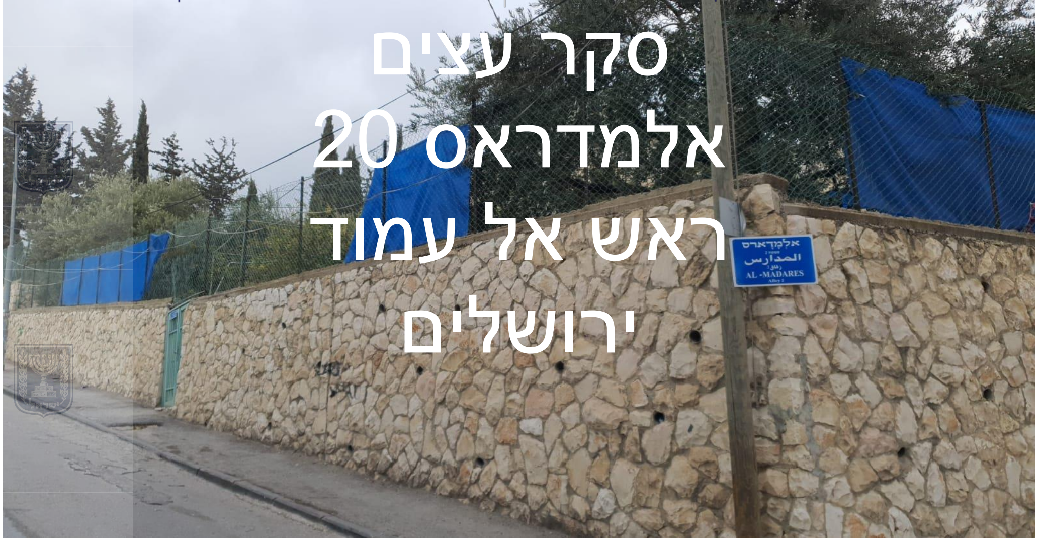
סקר עצים - אל מדארס 20 ראש אל עמוד - ירושלים - 02.01.22