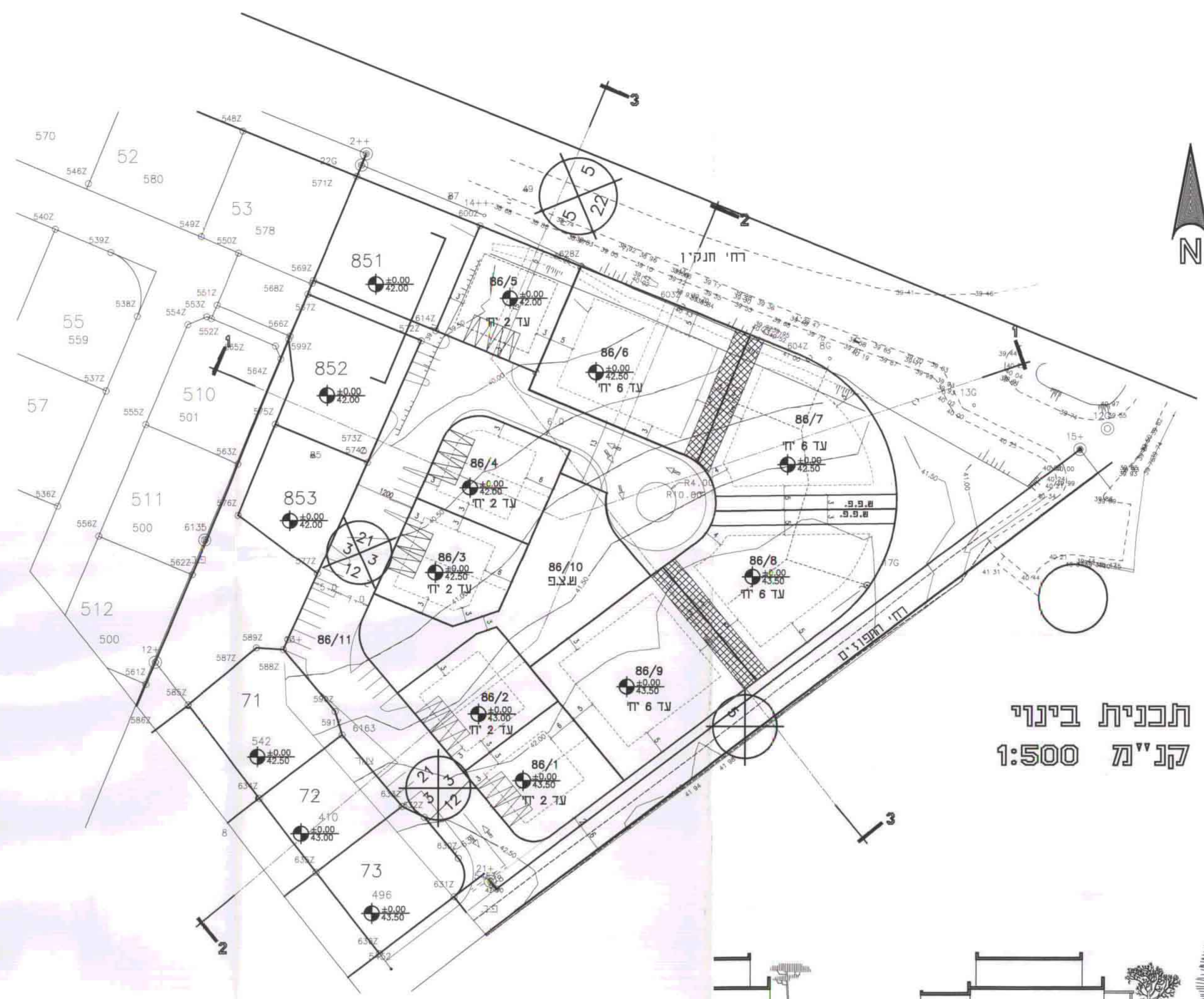
תכנית בינוי קנ"מ 1:500