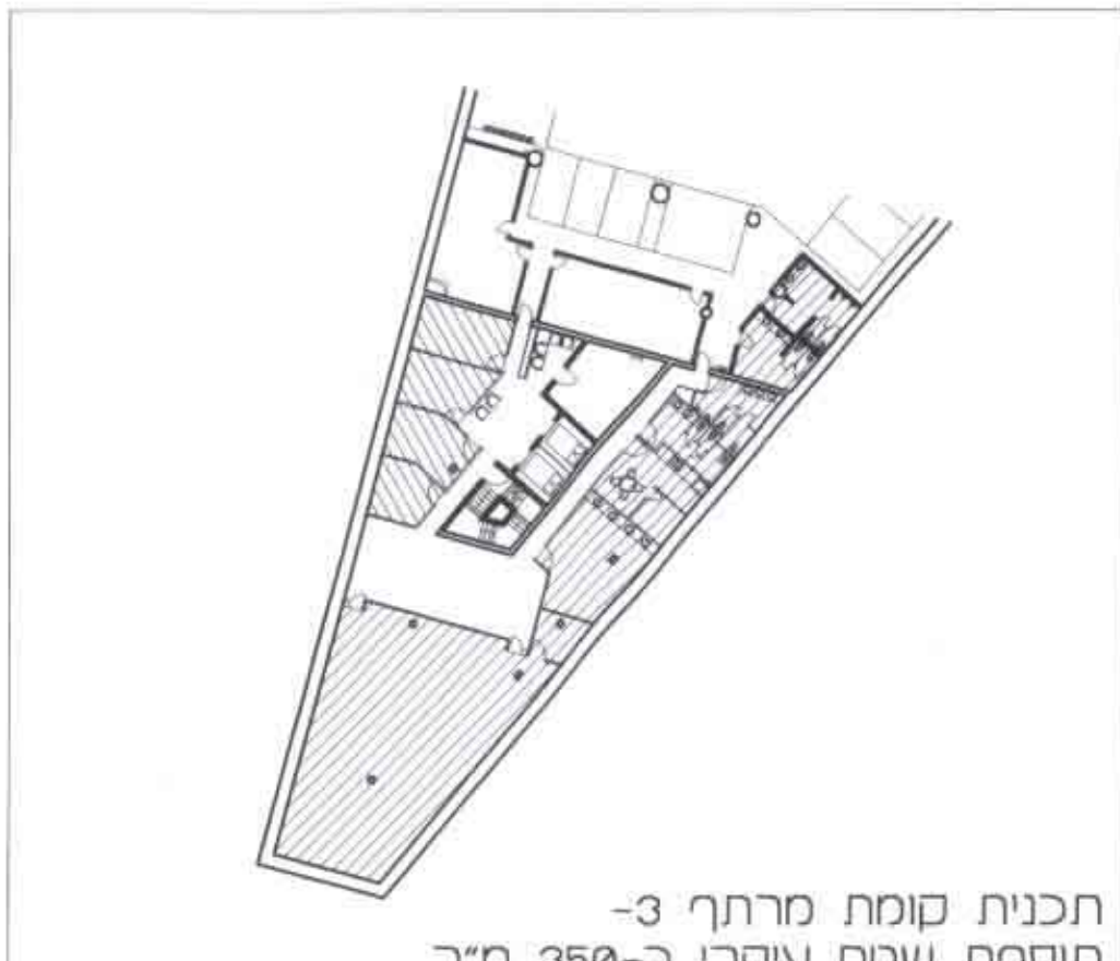
תכנית קומת מרתף-2 תוספת שטח עיקרי כ-350 מ"ר