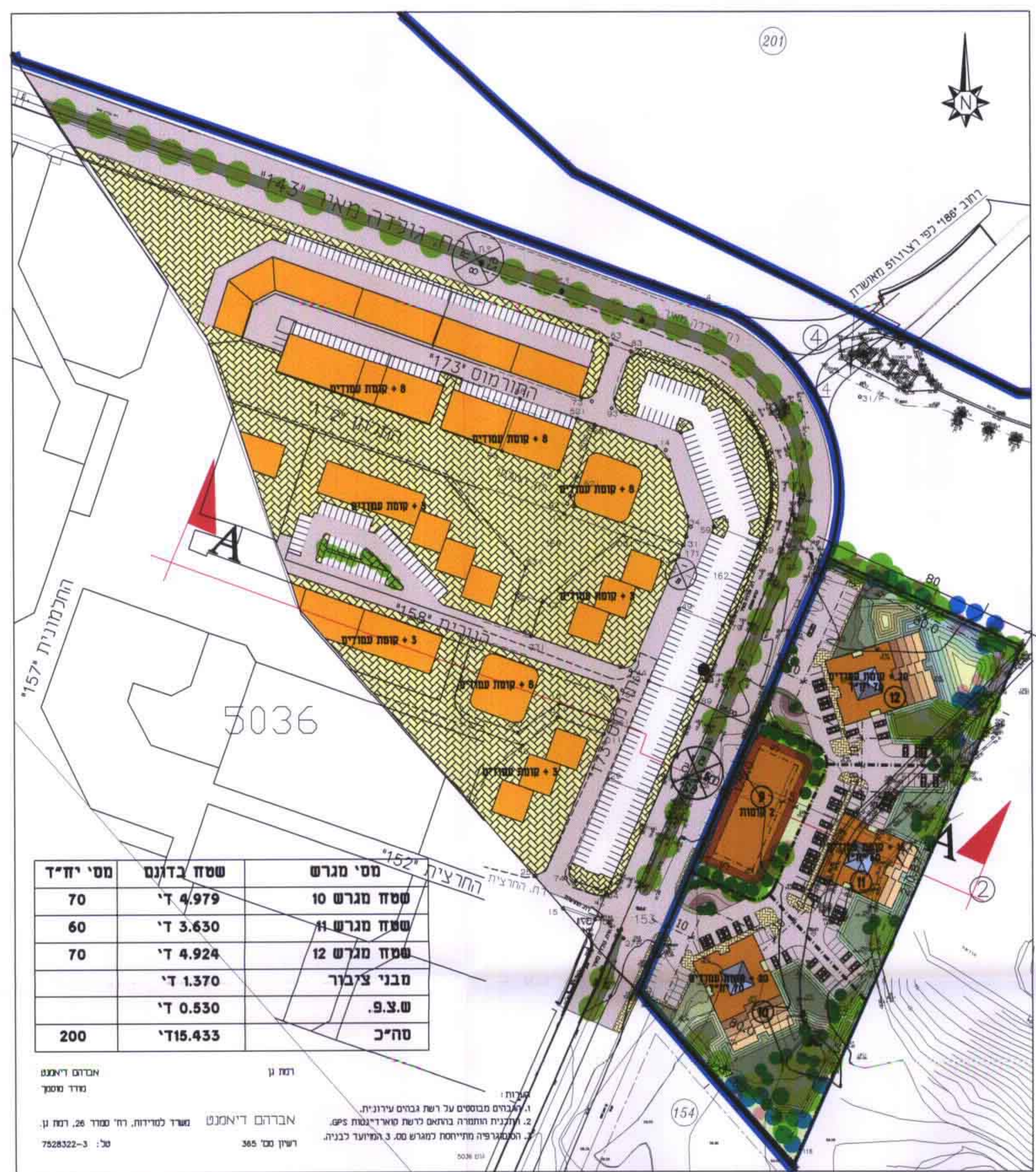
תכנית העמדה קנה מידה 1 : 1250

מ.מ. לייטרסדורף אדריכלים ומתכנני ערים (1972) בע"מ בשיתוף אדרי.י. כנורי