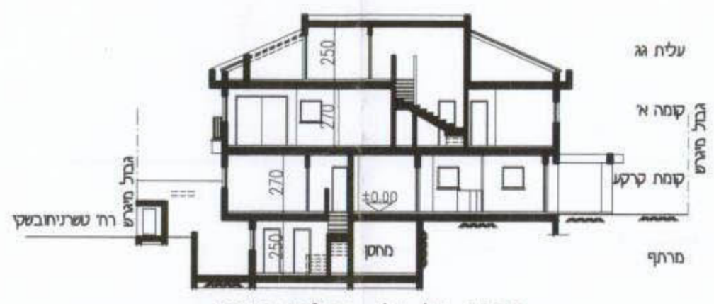
1:250 קנ"ח א'-א' קנ"ח 1:250