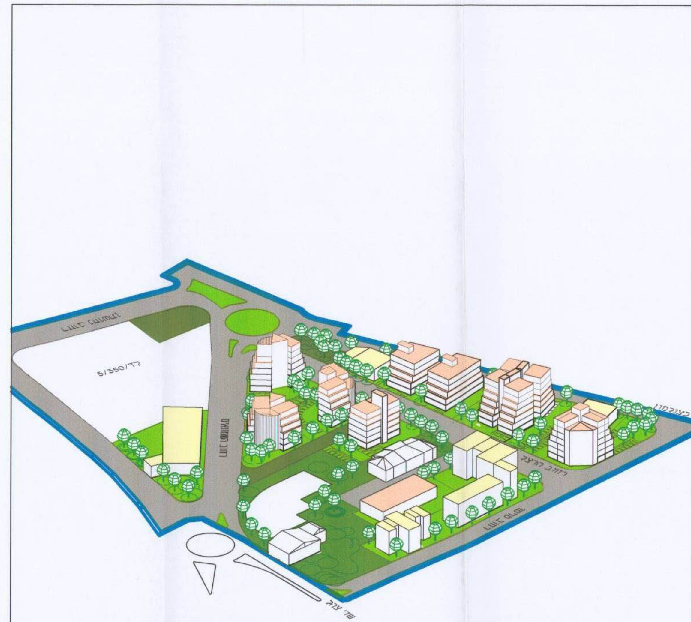
מבט משדרות צהל ק.מ. 1:1000