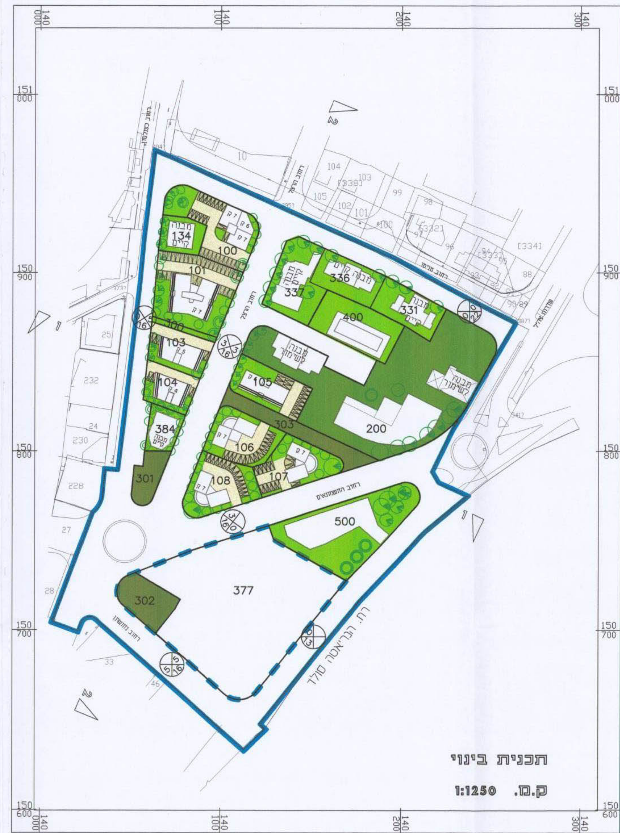
תכנית בינוי ק.מ. 1:1250