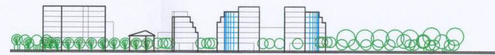
זווית 2-2 ק"מ 1000