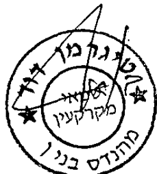
דוד טיגרמן - מהנדס שמאי מקרקעין