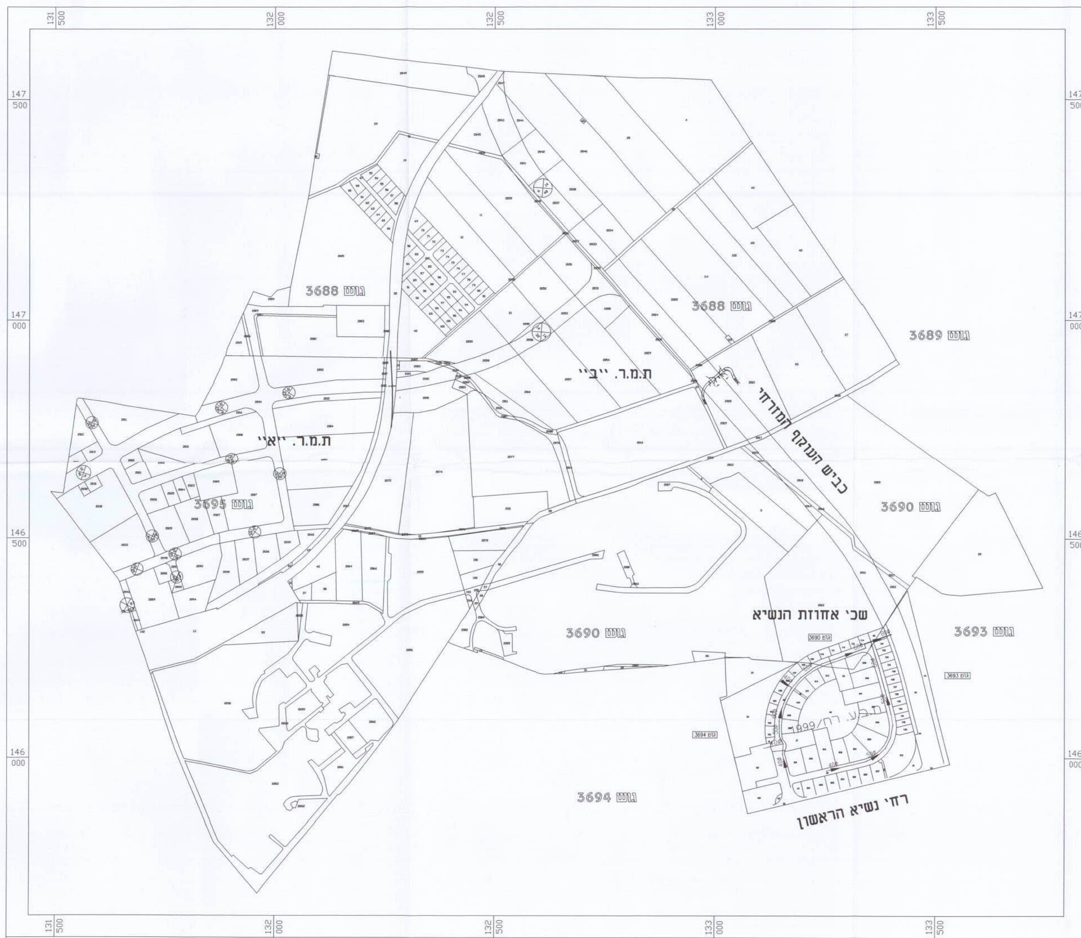
תרשים סביבה קנ"מ 1:5000

משרד הפנים מחוז המרכז חוק התכנון והבניה תשכ"ח - 1968 אישור תכנון מס' 1999/א חוק התכנון והבניה תשכ"ח - 1968 חוק מס' 3.6.01 לאשר את התכנון הועדה המחוזית לתכנון ולבניה תל אביב סמל: 3.6.01 יורד הועד המחוזית