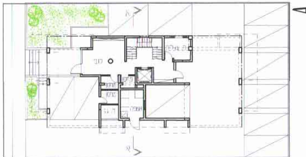
תכנית קומת קרקע

גאודע-ניחול ומידע מקרקעין ונכסים בע"מ אימות אישור אושרה לתוקף ע"י ועדה שם _____ חתימה _____