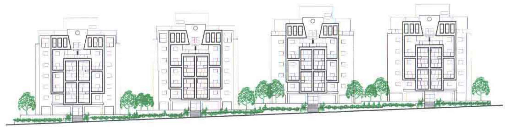
חזית מרחי' בן גוריון