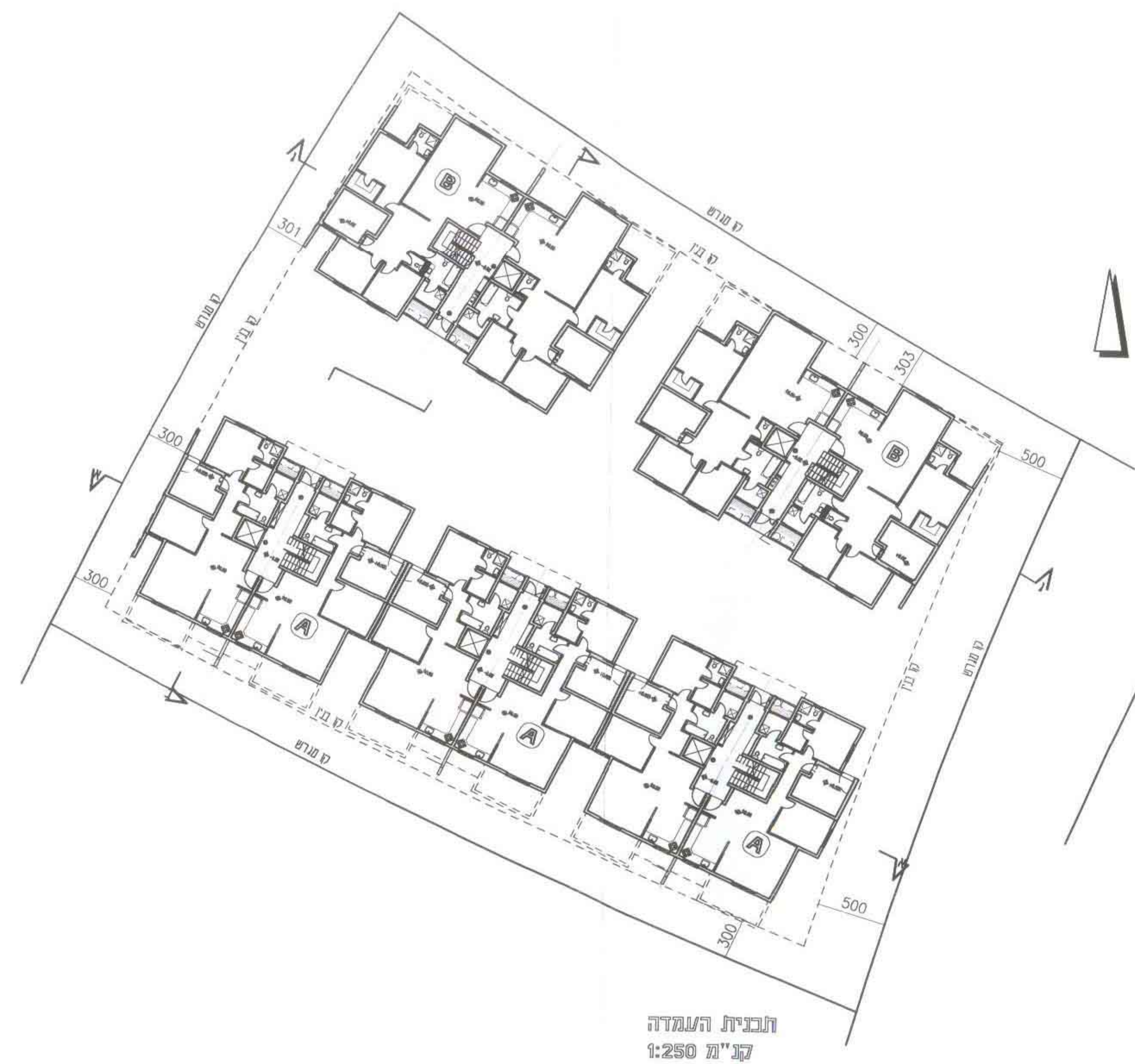
תכנית המעדה קני"מ 1:250