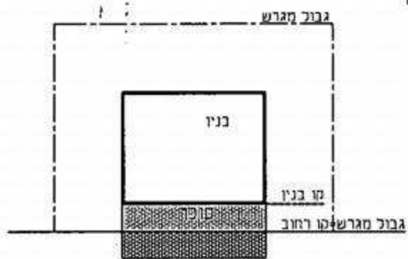
הסוכר נמצא בתוך ומחוץ המגרש (ב)