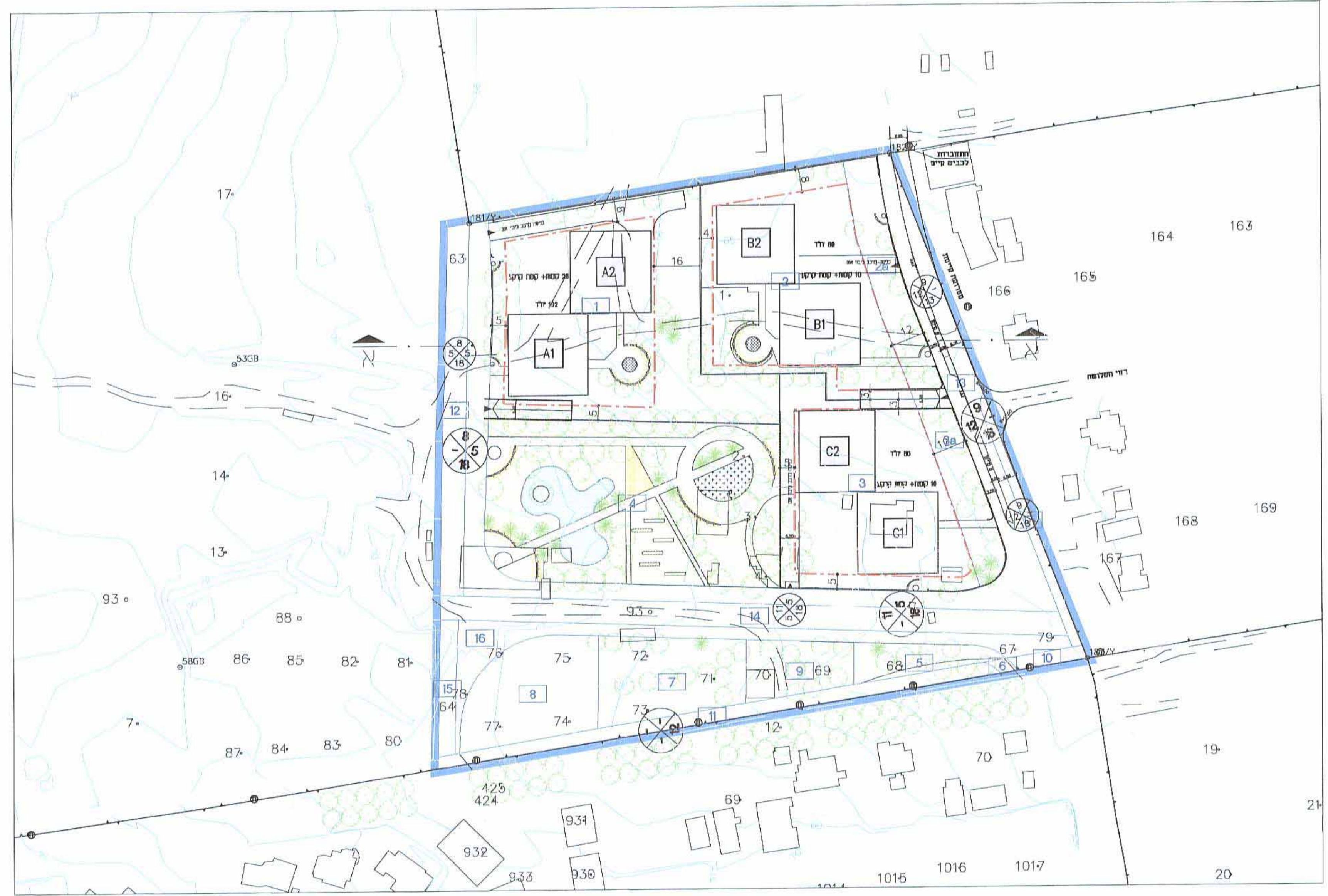
תכנית בינוי ק.מ. 1:1000