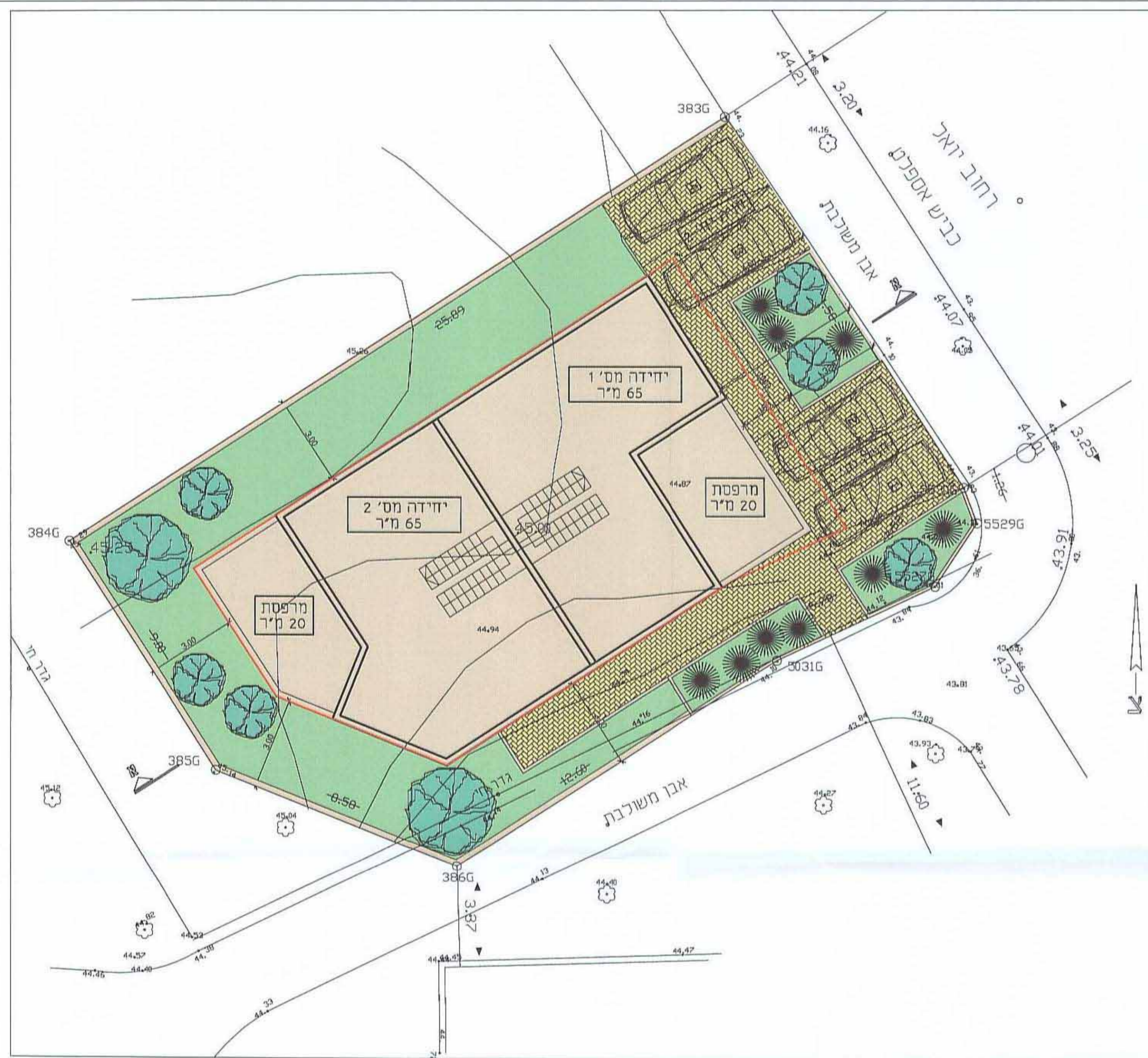
תכנית בינוי קומה ראשונה קנ"מ 1:100 130 מ"ר