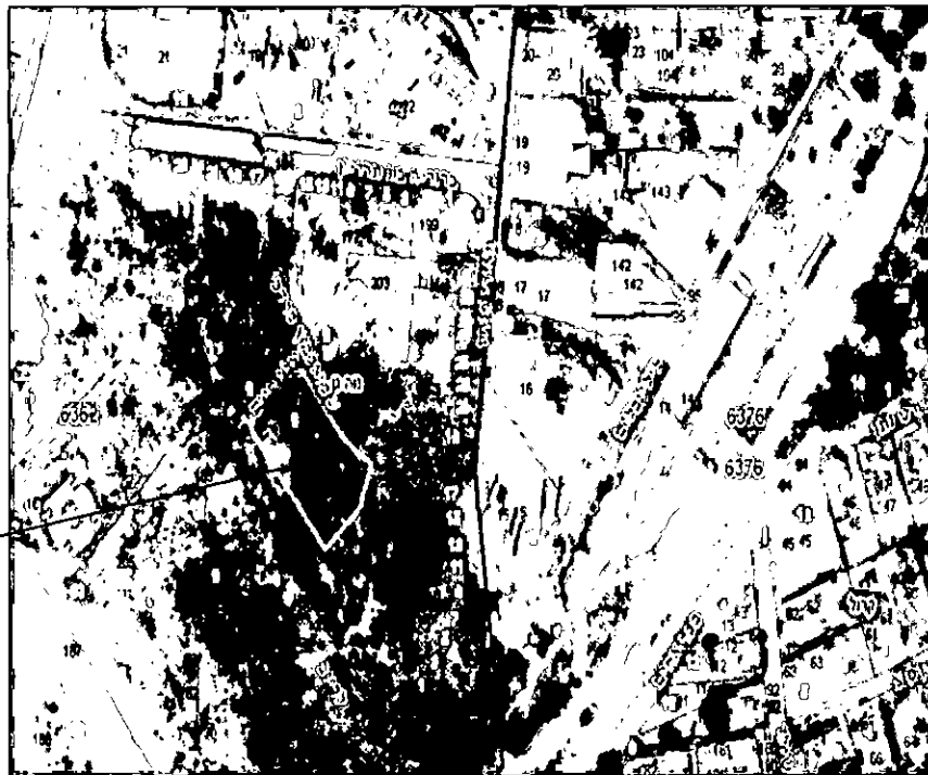
מבט מהאוויר אל החלקה