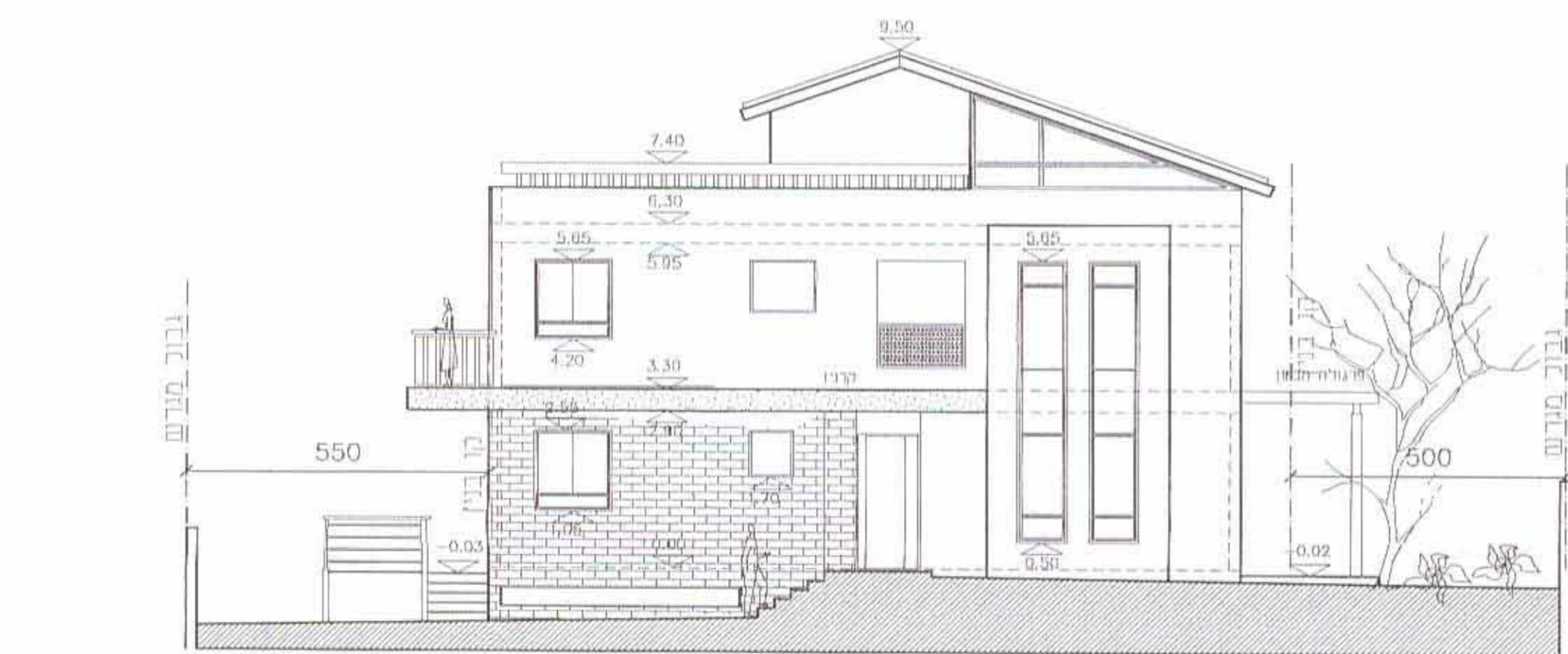
חזית מערבית קנ"מ 1:100