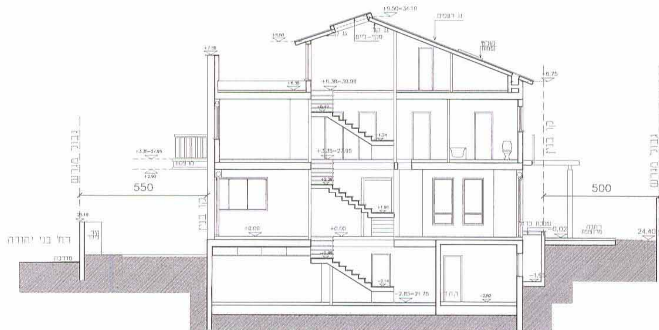
חתך א'-א' קנ"מ 1:100

שלב: מילוי תנאים למחן חוקף מהדורה : 1 תאריך : 23/06/13