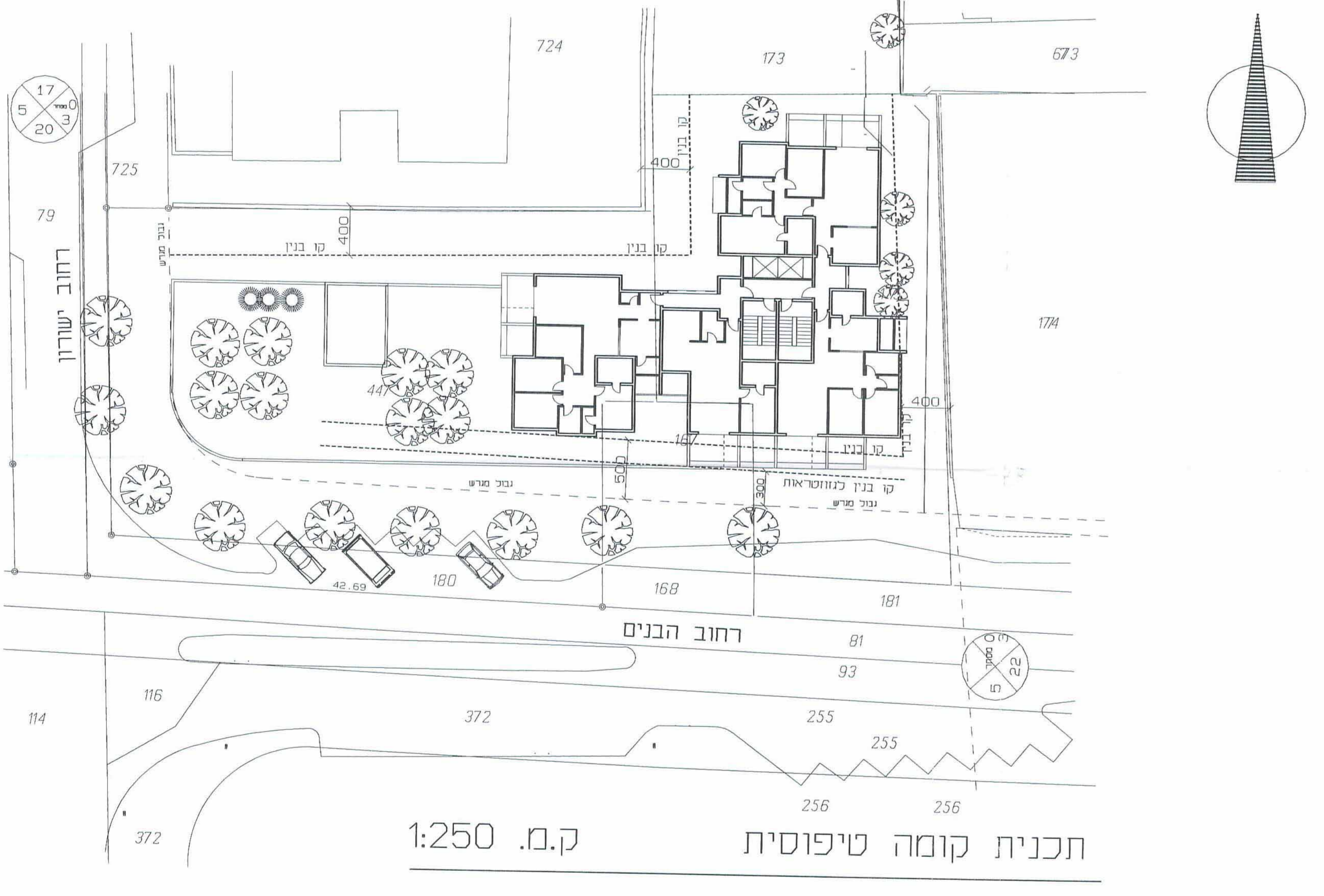
תכנית קומה טיפוסית ק.מ. 1:250

תוקף תכנית הבנייה והשכית - 1965 משרד הקנים - פרום המרכז תוקף פטור התוכנית מס' 22 כלכלת (מסלול 22) תיק מס' 44163-09 התכנית ... גית יאיר אורניל יתומלא תוקף פטור התוכנית מס' 22 תוקף פטור התוכנית מס' 22 תוקף פטור התוכנית מס' 22 תוקף פטור התוכנית מס' 22 ג. פרומט, חסון בנימין