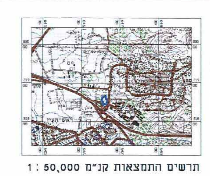
תרשים התמצאות קנ"מ 1:50,000