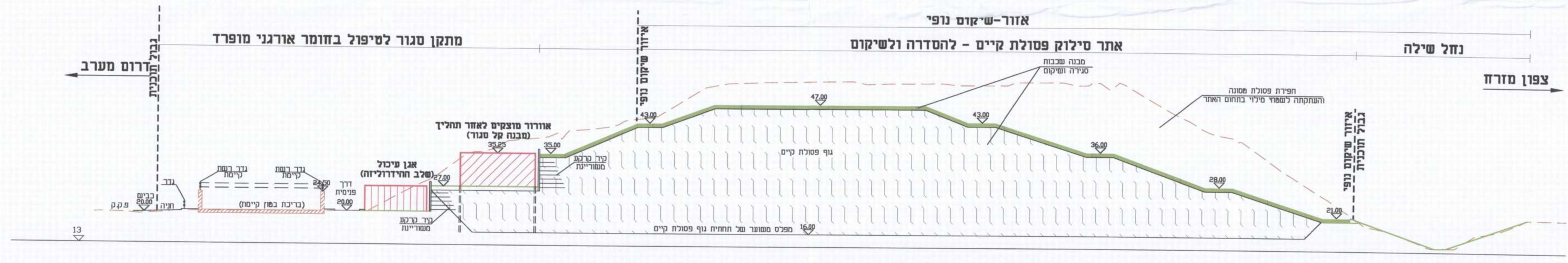
חתך 2-2: חתך טיפוסי לאורך מתקן טיפול בחומר אורגני מופרד, אתר הפסולת ונחל שילה 1:500/1:500