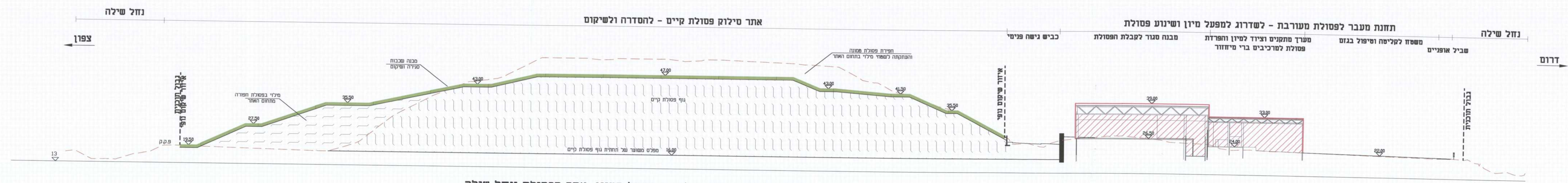
חתך 1-1: חתך טיפוסי לאורך מפעל המיון, אתר הפסולת ונחל שילה 1:500/1:500

מ.א.ג.ל.ה.ת.ס.ה.י.ש.ן (2002) קני"מ ח.פ. 513184630