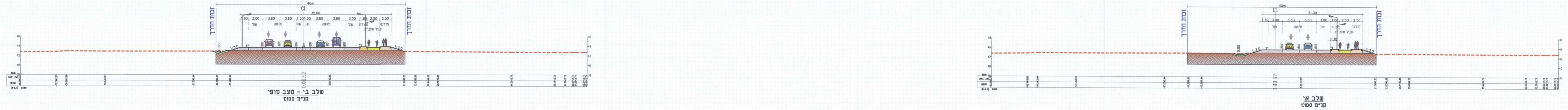
שלב ב' - מצב סופי