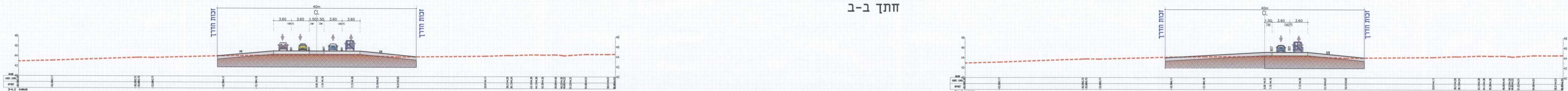
שלב ב' - מצב סופי