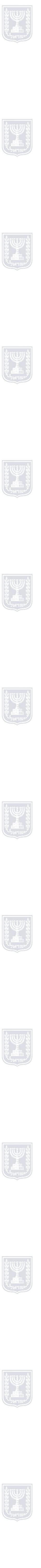
טבלת מאזן חגורה