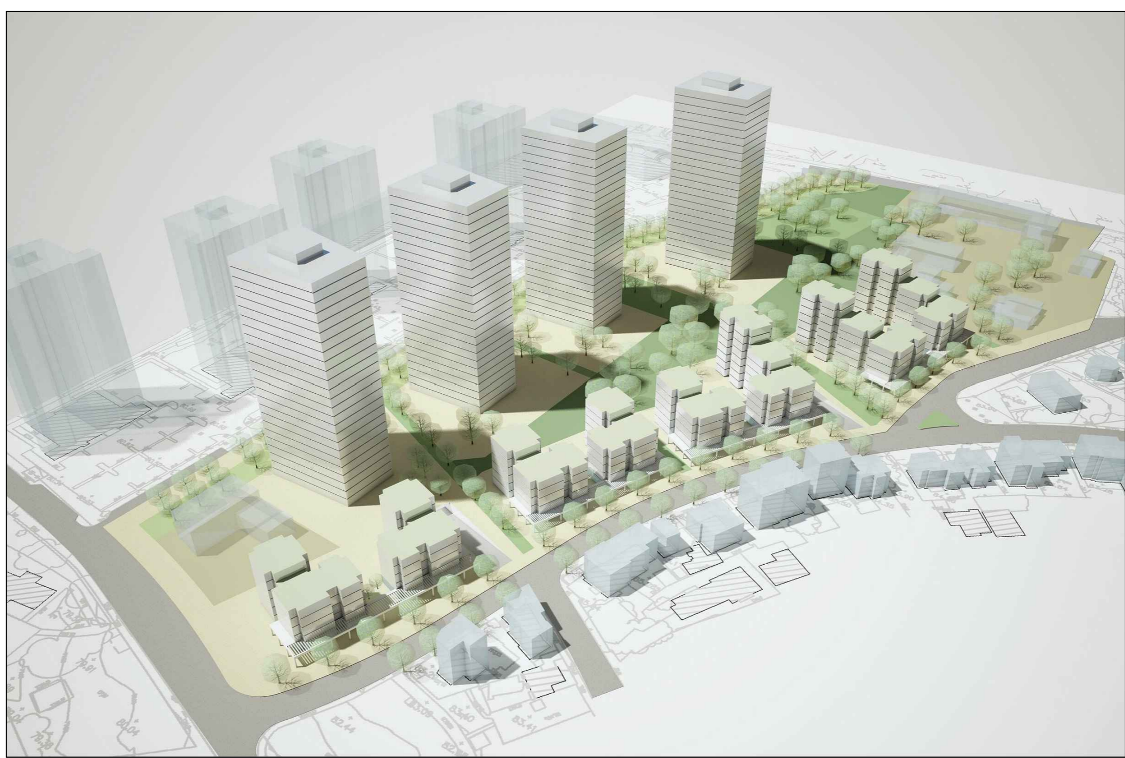
מבט על מכיוון דרום מזרח