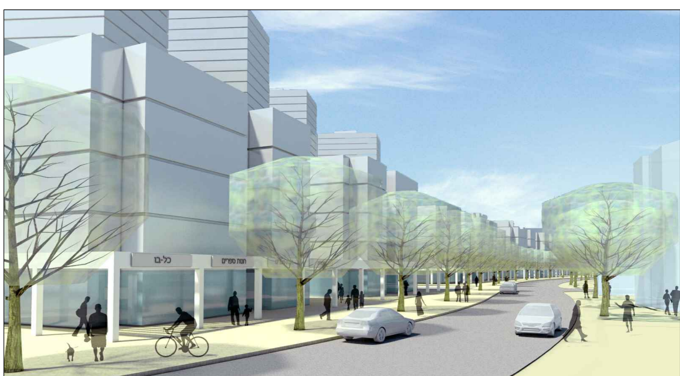
מבט מרחוב יהושוע בן-נון