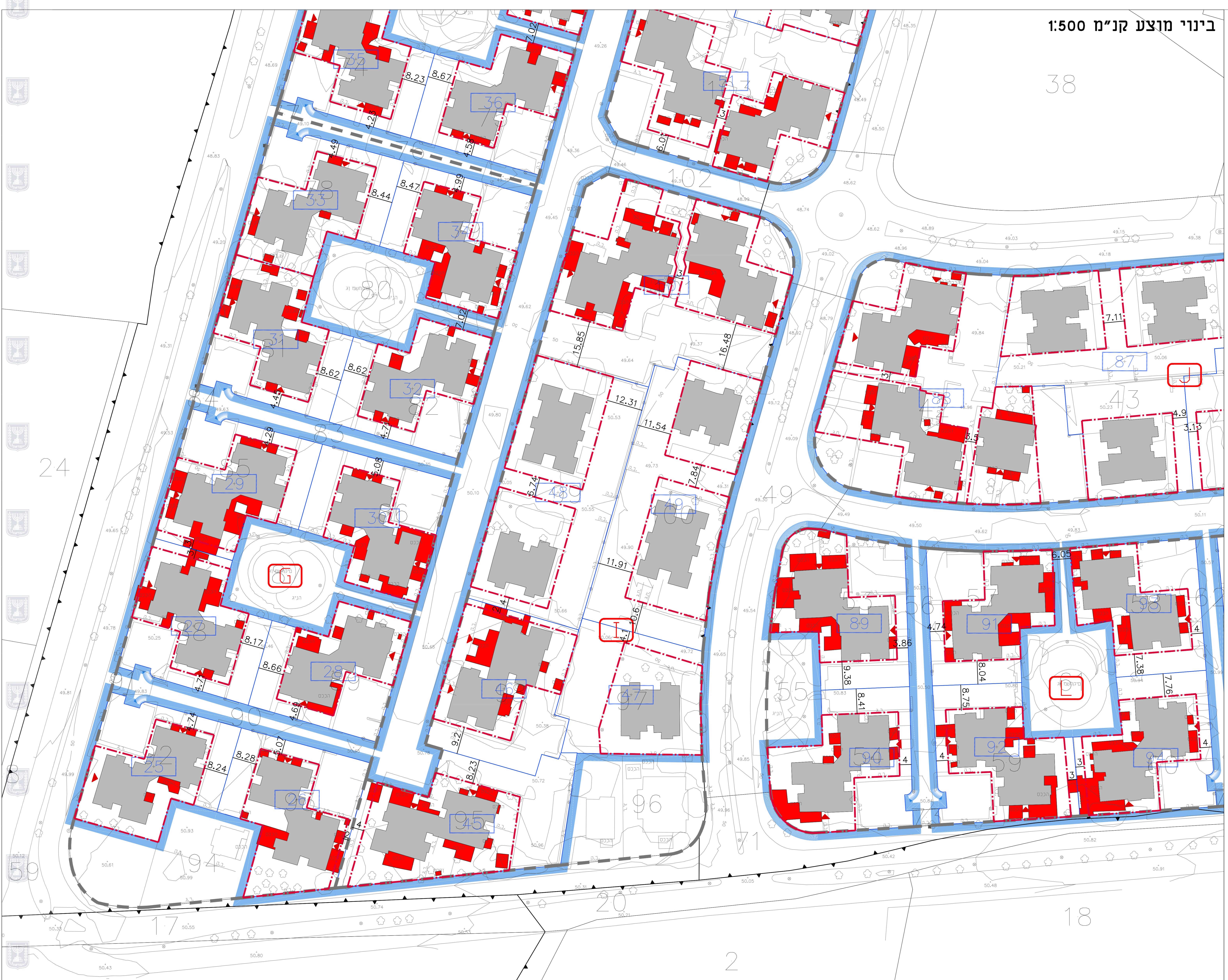
בינוי מוצע קנ"מ 1:500