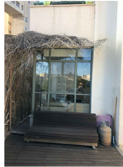
חזית קדמית מרחוב נחל עיון