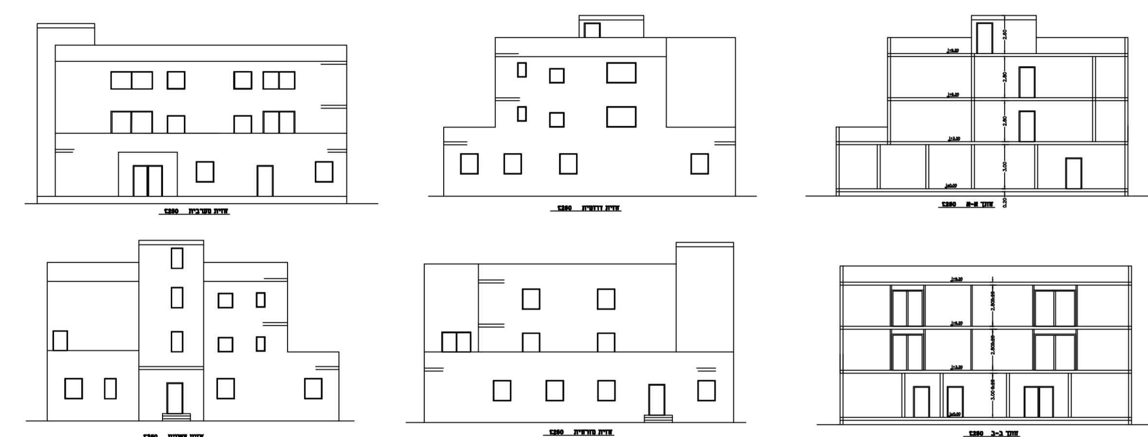
מגרש מס' 10/34 - חא מס' 4 תכנית של הרבנה (מוצע קיים)