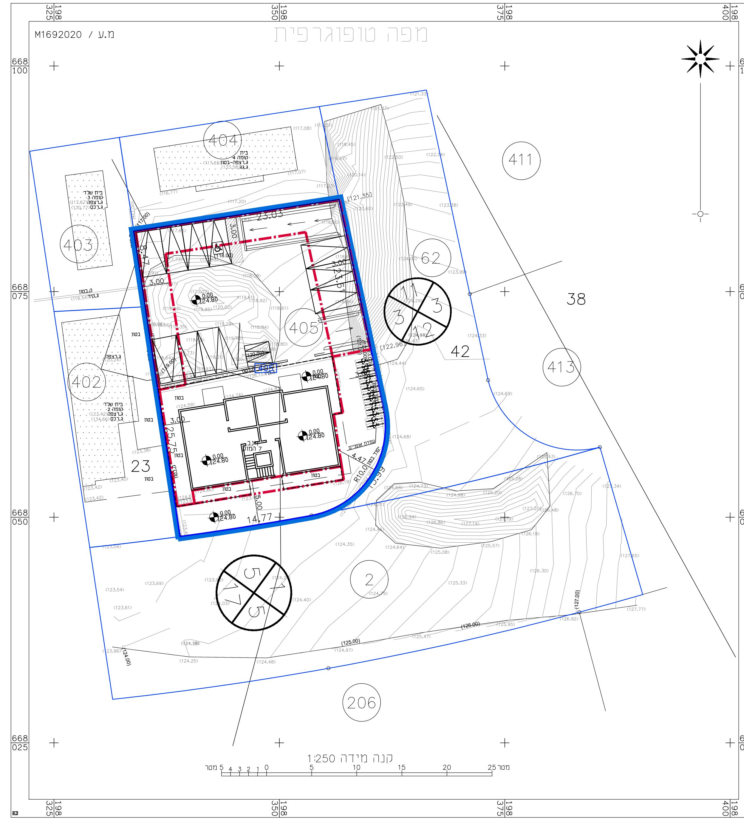
תכנית חניה\בינוי קומת קרקע קנ"מ 1 : 250