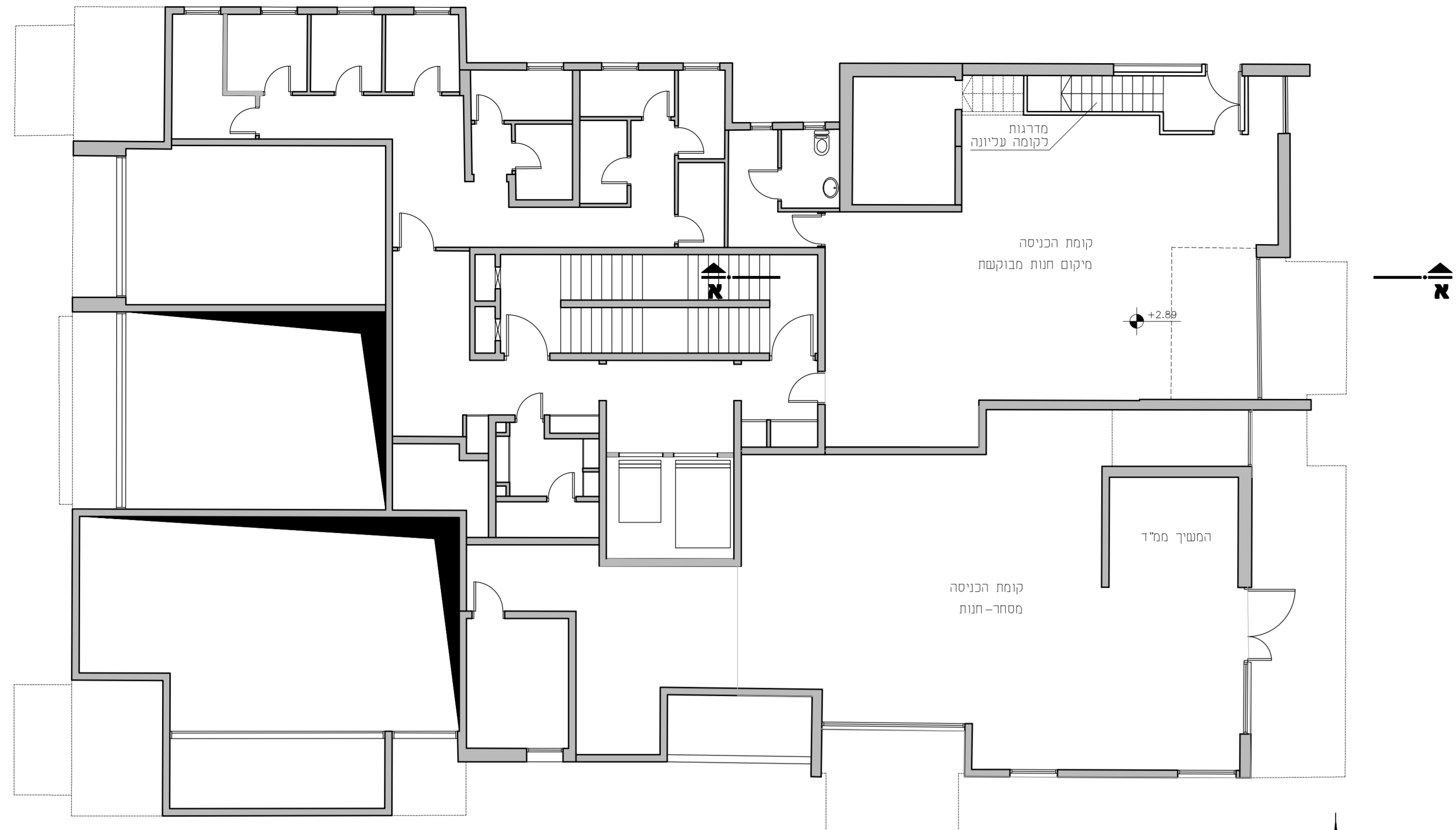
ת. קומת הכניסה קנ"מ 1:100