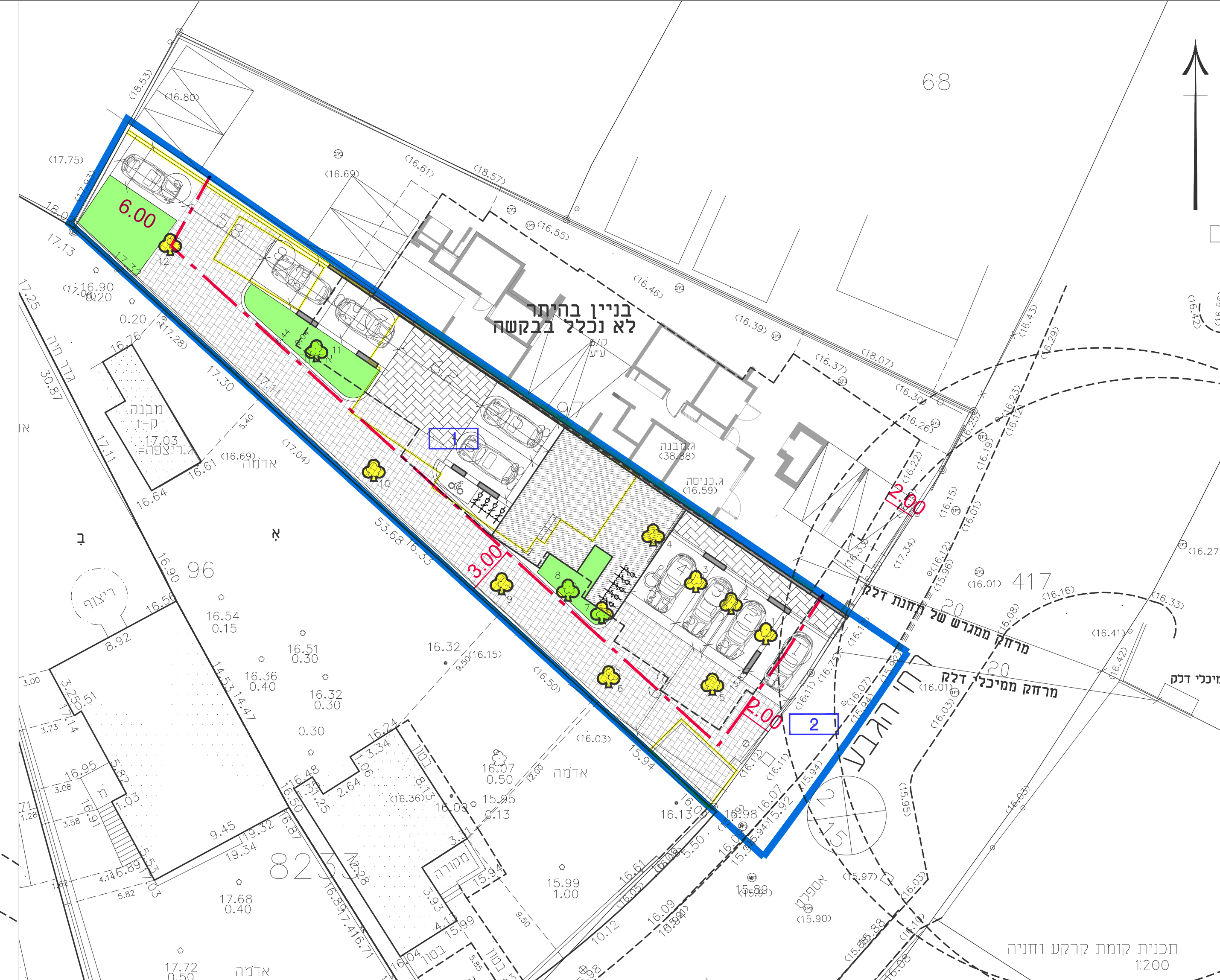
תרשים קווי בניין 1:200