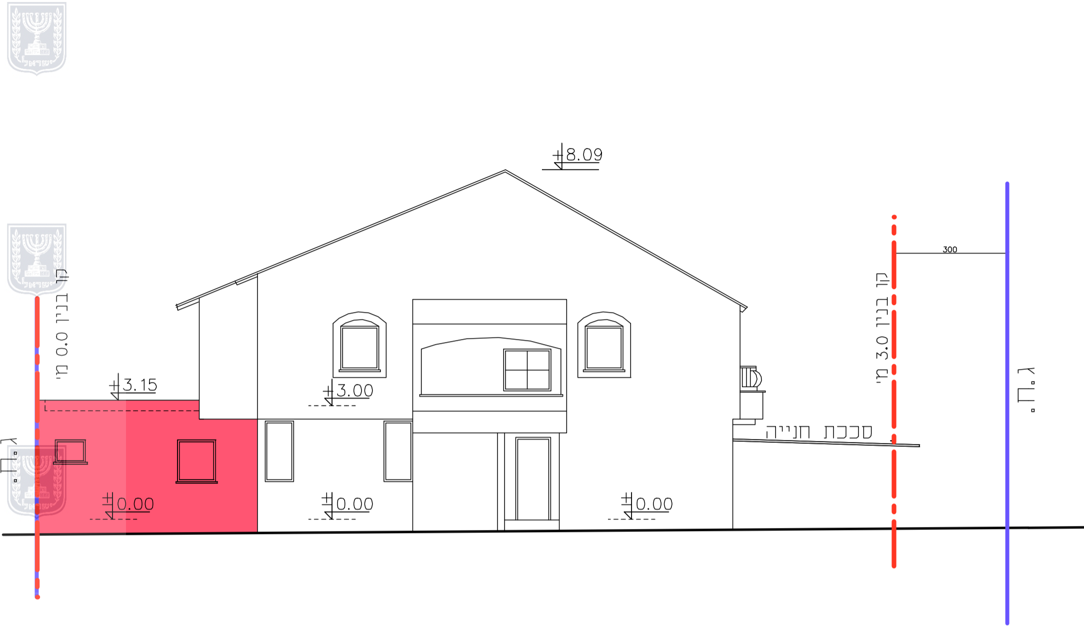
חזית מזרחית 1:250