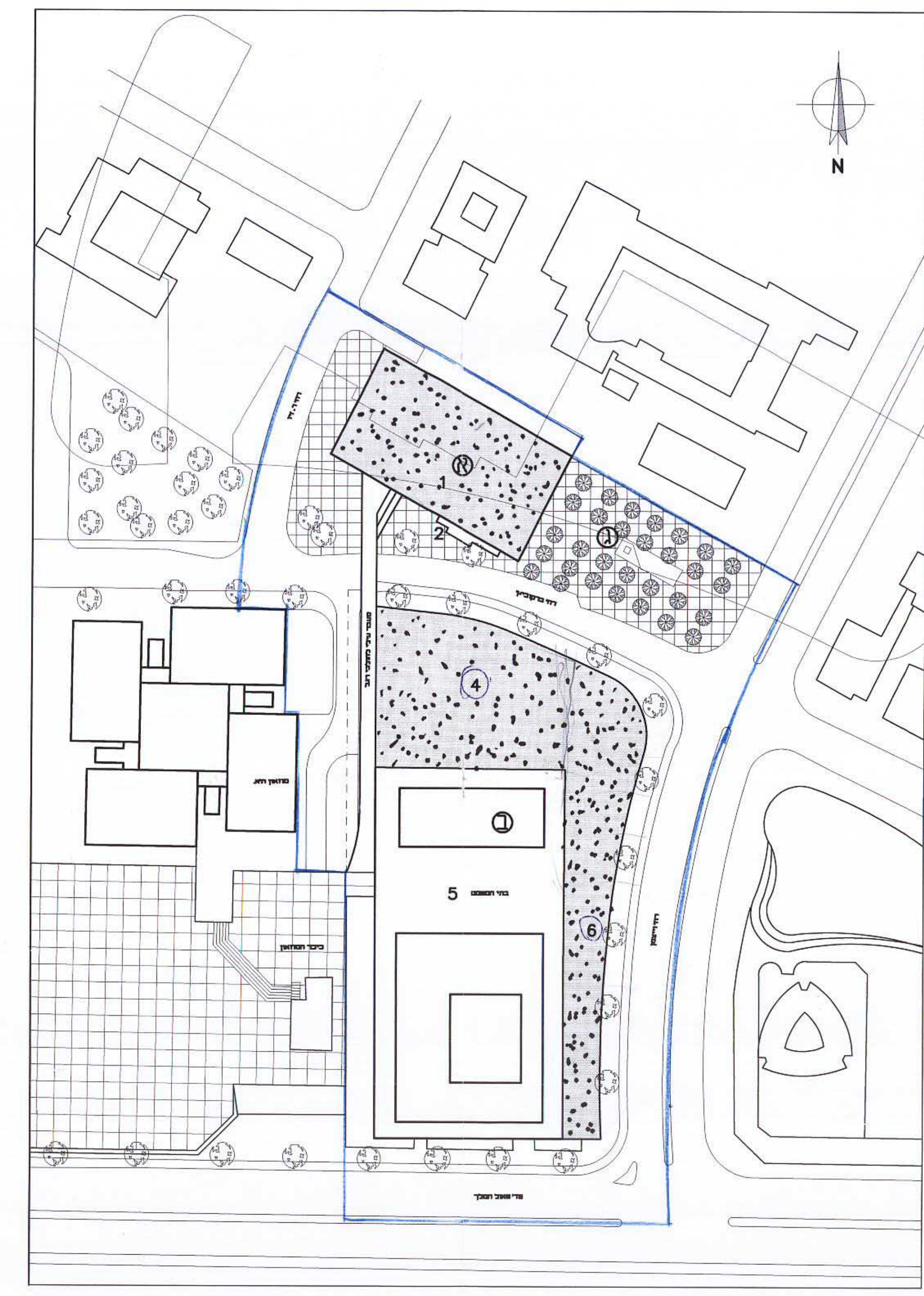
תכנית בינוי ק.ב. 1000