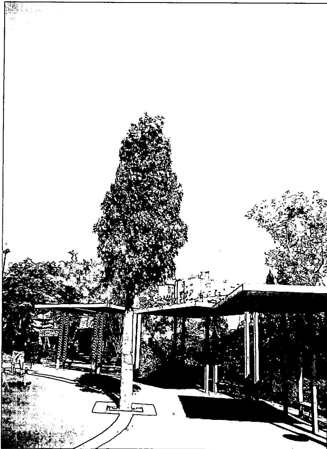
[4] ברכיטון דו-נוצתי