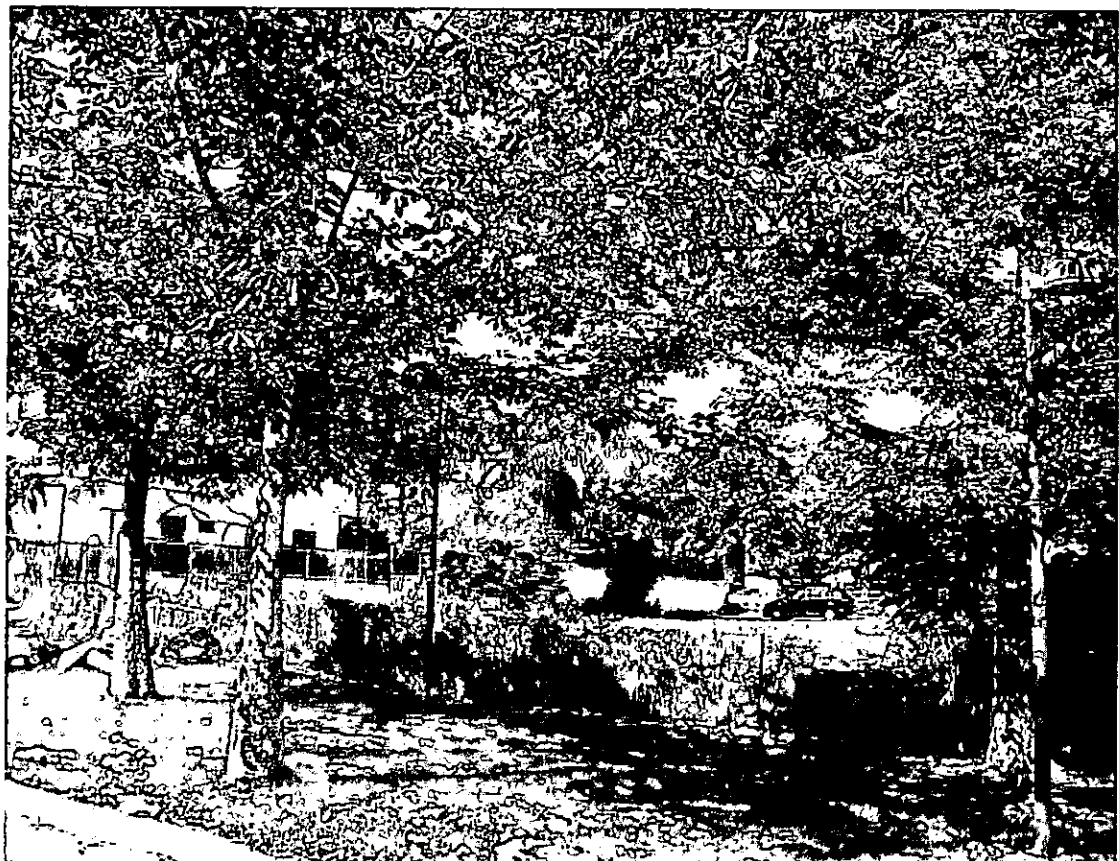
בומבקס הודי [16] משמאל, [17] שמאל מרכז, [18] מימין