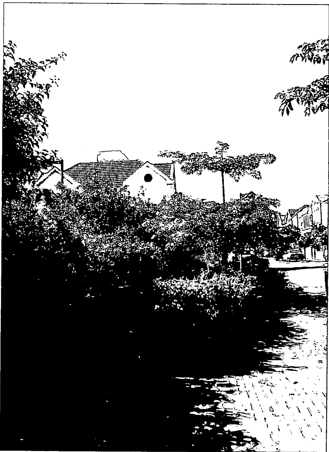
[15] בומבקס הודי

כנרית 288 מכבים 71908 פקס: 08-9261670 נייד 050-5410862 E-mail: amos.rose@gmail.com