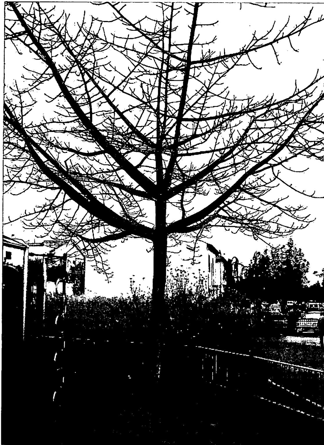
בומבקס הודי [5]

כנרת 288 מכבים 71908 פקס: 08-9261670 נייד 050-5410862 E-mail: amos.rose@gmail.com