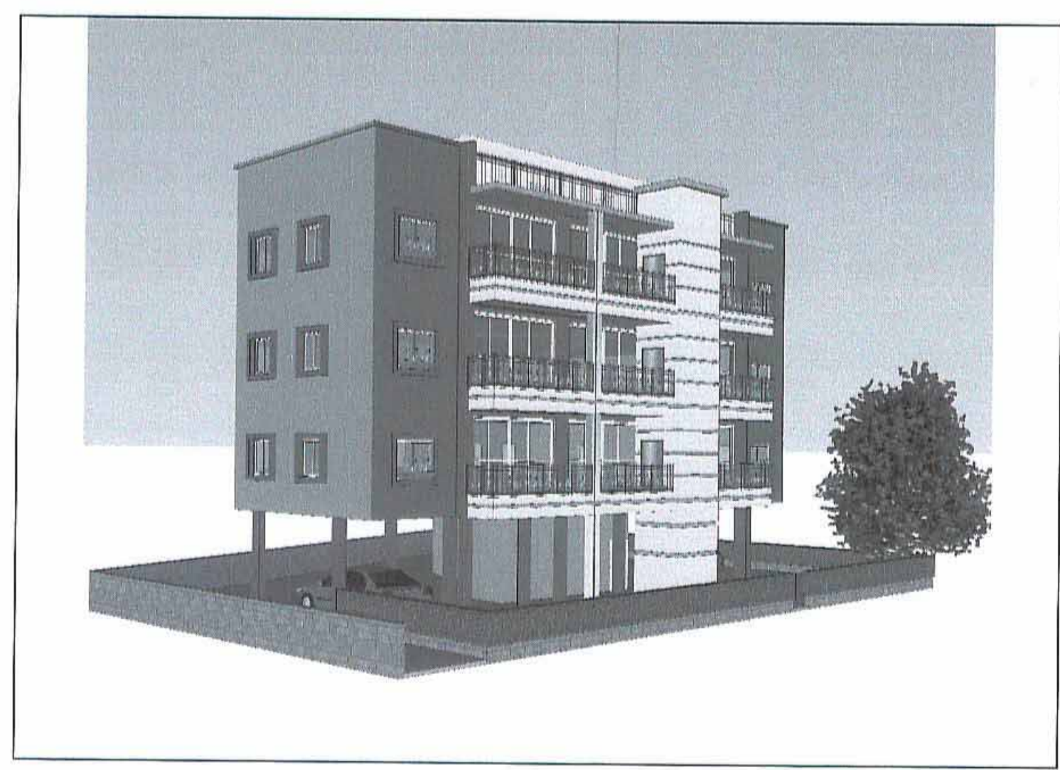
הדמיה- חזית לרחוב להמחשה בלבד