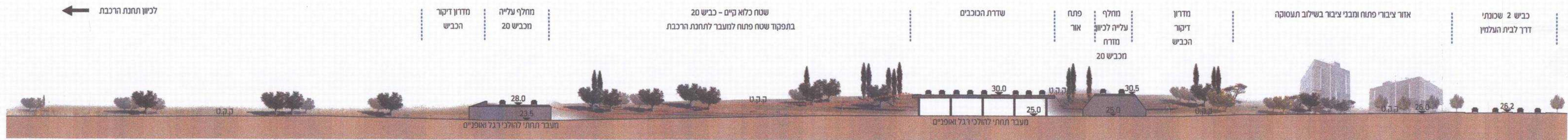
חתך ג-ג ק.מ 1:500 תשריט אילוסטראטיבי למעבר בין מתחם משולב תעסוקה ושצ"פ ע"פ תכנית הר\1985 לאזור המסומן בתמ"מ כאזור מוטה תחצ"צ בדגש תעסוקה