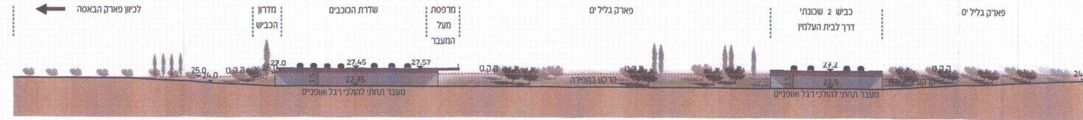
חתך ב-ב ק.מ 1:500 חלופה אילוסטראטיבית ב': מעבר מתחת לכביש 2 שכונתי ושדי הכוכבים לכיוון פארק הבאסה