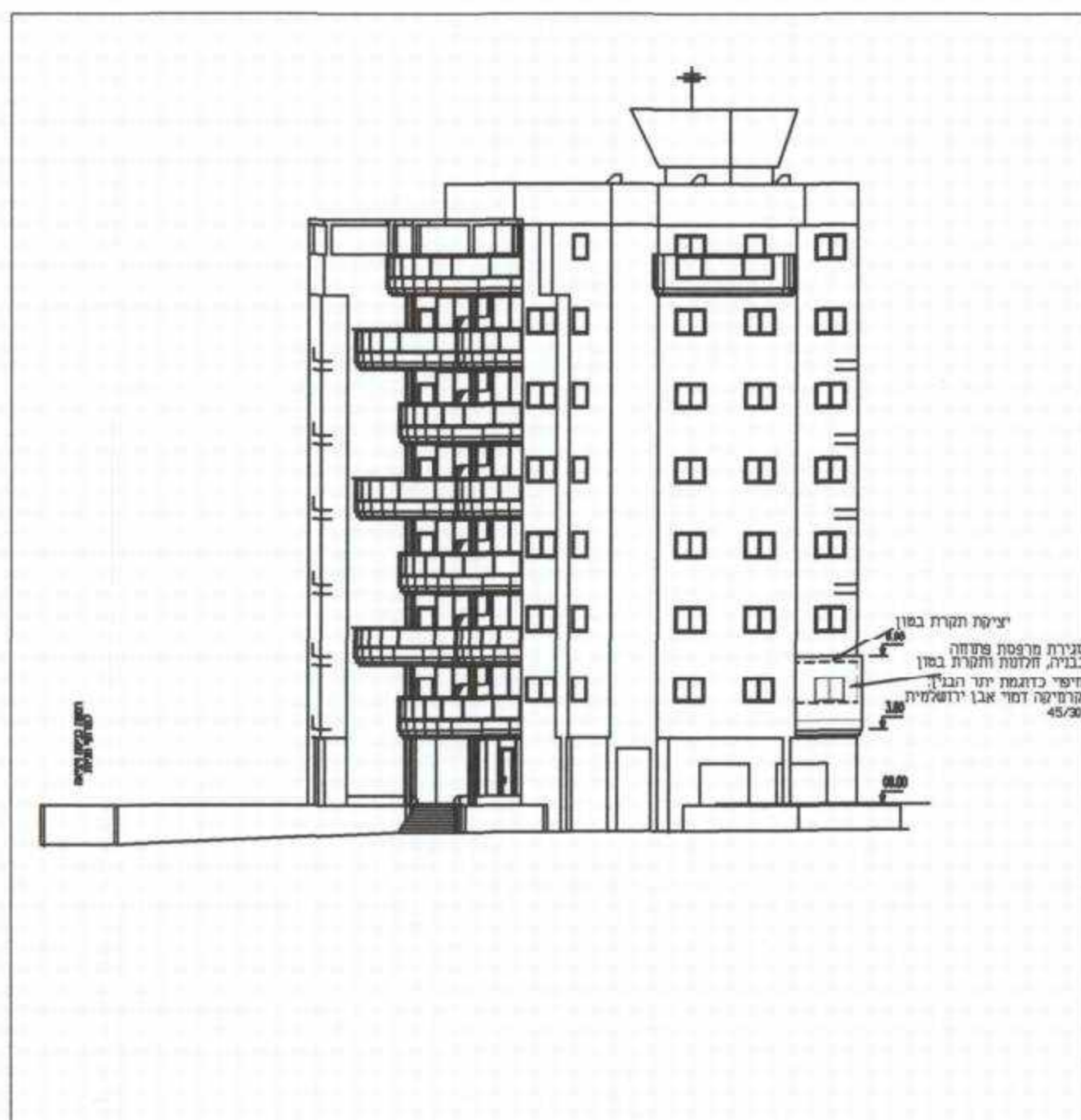
חזית מצב מוצע קנ"מ 1:200