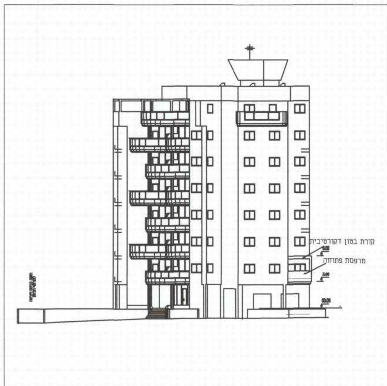
חזית מצב קיים קנ"מ 1:200

משרד הפנים מחוז תל-אביב חוק התכנון והבניה תשכ"ה - 1965 אישור תכנית מס' 561/ח הועדה המחוזית לתכנון ולבניה החליטה ביום 24.9.12 לאשר את התכנית מלח זורנו יו"ר הוועדה המחוזית