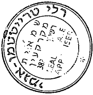
פרטי החלקות הקיימות