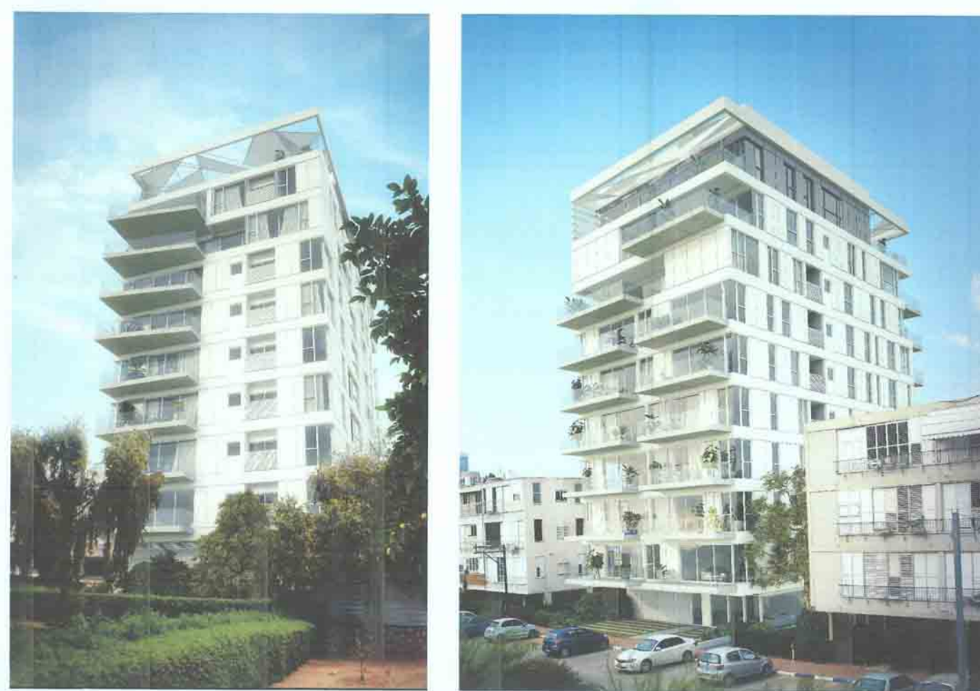
מבט מכיוון מערב / מבט מכיוון מזרח