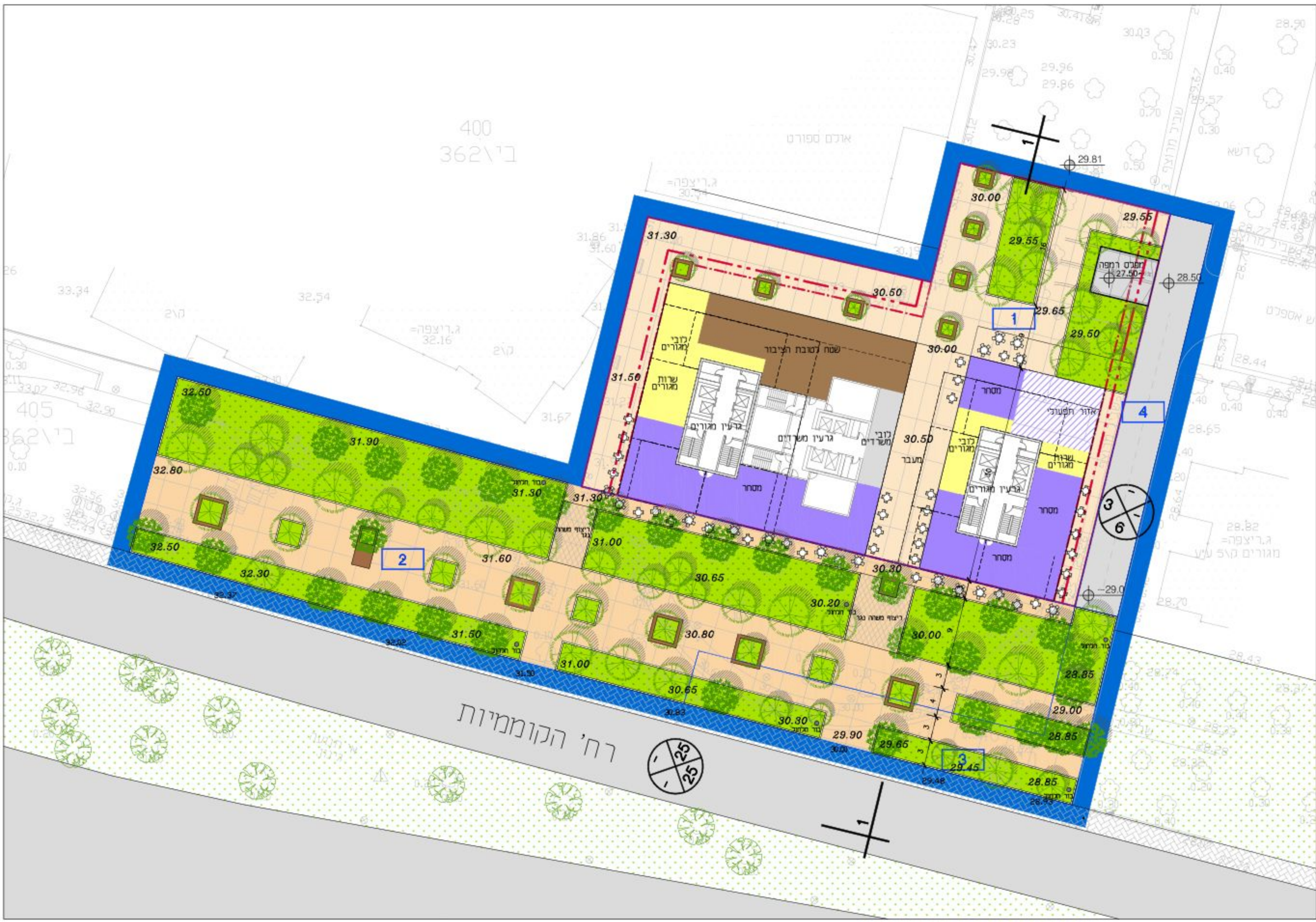
תכנית פיתוח 1:500