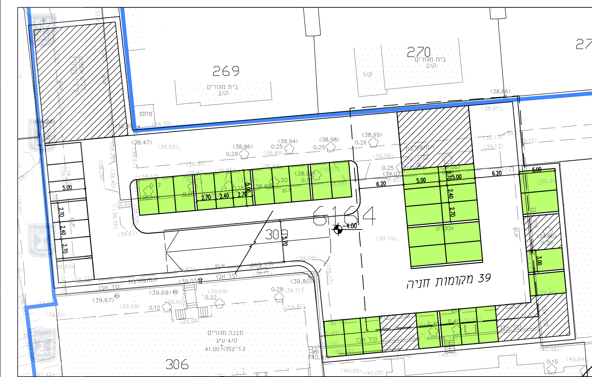
קומת מרתף טיפוטית