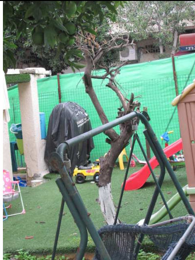
עץ מס' 8 - הדר