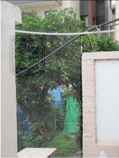
עץ מס' 6 - הדר