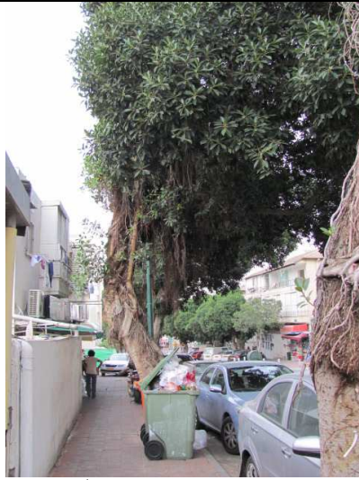
עץ מס' 2 - פיקוס חלוד