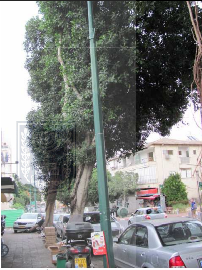
עץ מס' 3 - פיקוס חלוד