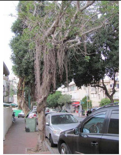
עץ מס' 1 - פיקוס חלוד