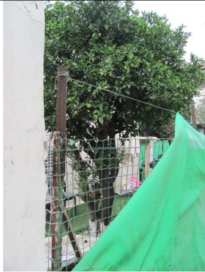
עץ מס' 5 - הדר