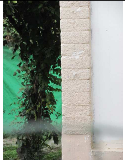
עץ מס' 7 - הדר