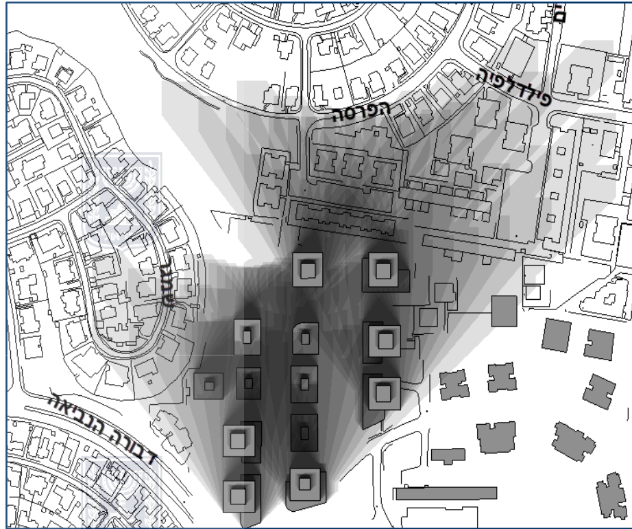
חותם הצל של התכנית ביום ה-21 בדצמבר בין השעות 9:00-15:00

חותם הצל של התכנית ביום הקצר בשנה, בין השעות 9:00-15:00 משפיע בעיקר על השטחים המצויים בתחום התכנית ועל מבנים הסמוכים לתכנית מצפון ברחוב נהריים 10-18 (זוגיים) וברחוב נהריים 1, 3 ו-5 המוצלים למשך כ-3-4 שעות ע"י בינוי התכנית.